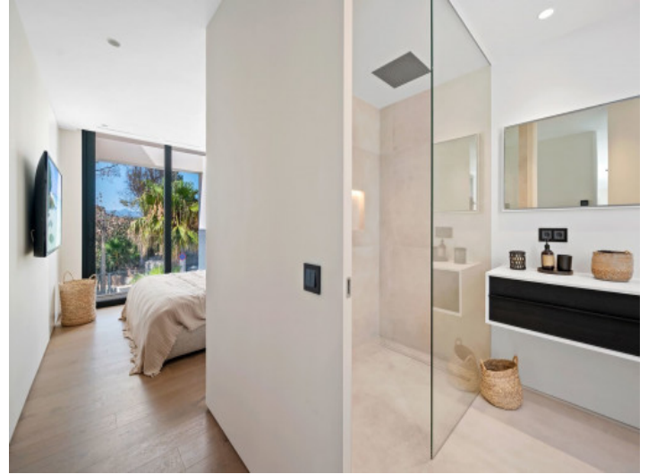
Bad en Suite