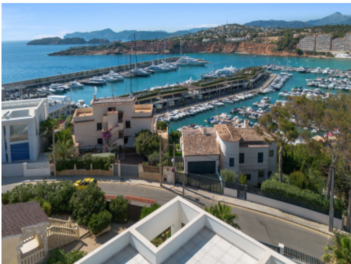
Weitblick von der Dachterrasse

Alle Angaben nach bestem Wissen. Irrtum und Zwischenverkauf vorbehalten. Dieses Exposé ist eine Vorinformation, als Rechtsgrundlage gilt allein der notariell abgeschlossene Kaufvertrag.