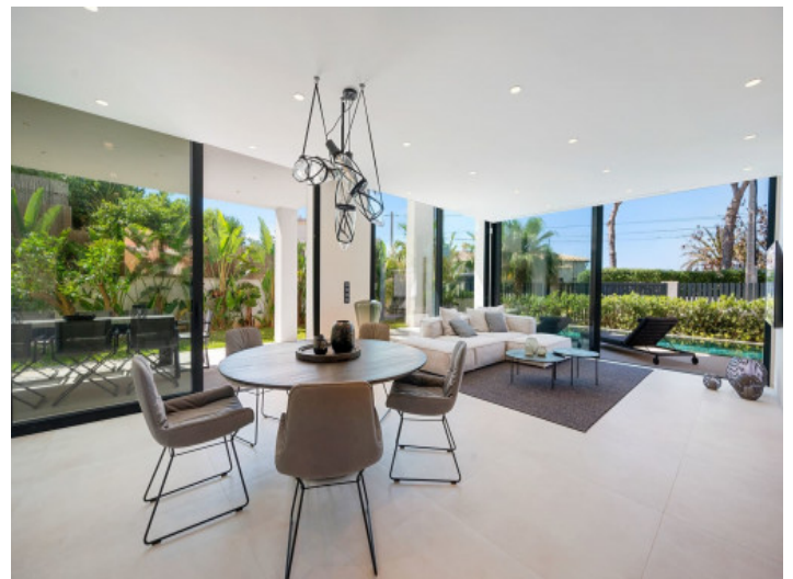
Heller Wohn-/ Essbereich

Alle Angaben nach bestem Wissen. Irrtum und Zwischenverkauf vorbehalten. Dieses Exposé ist eine Vorinformation, als Rechtsgrundlage gilt allein der notariell abgeschlossene Kaufvertrag.