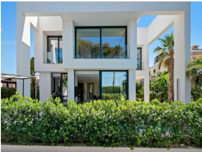
Elegante Villa in Toplage