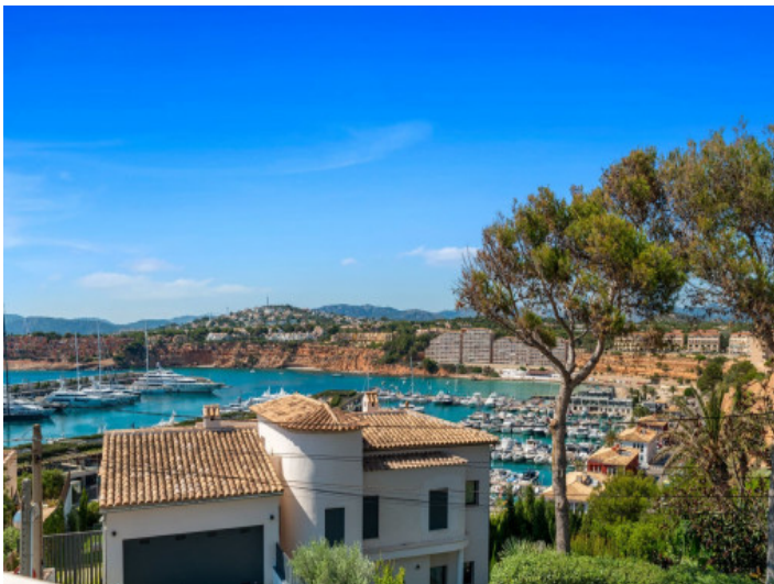
Villa in Toplage