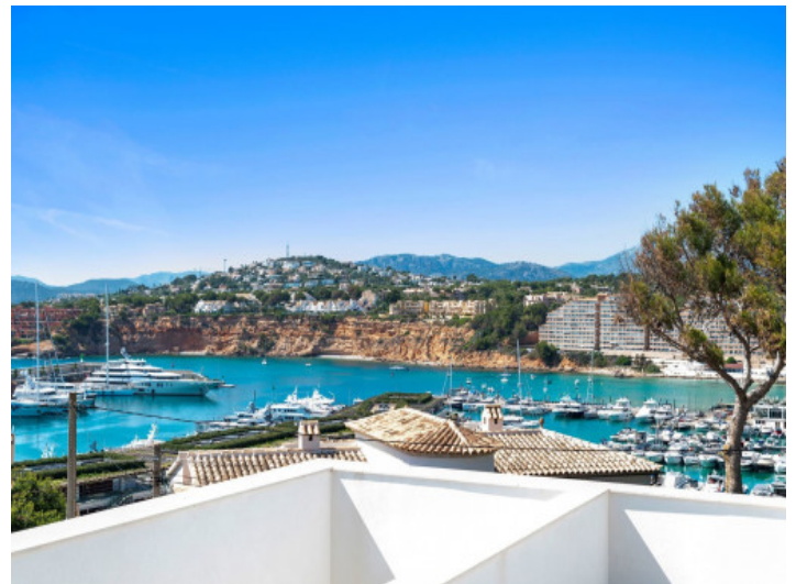
Hafensicht von der Dachterrasse