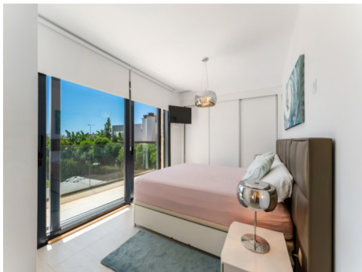
Eines von 3 Schlafzimmer