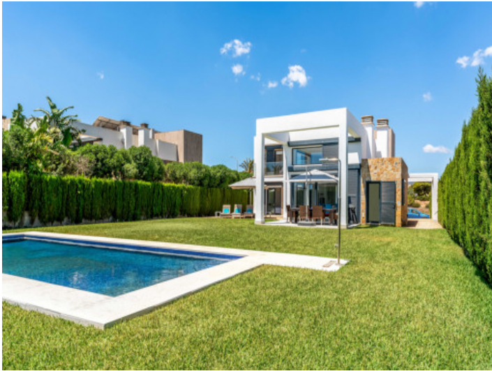
Pool und Garten der Villa