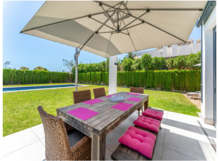
Essecke im Garten