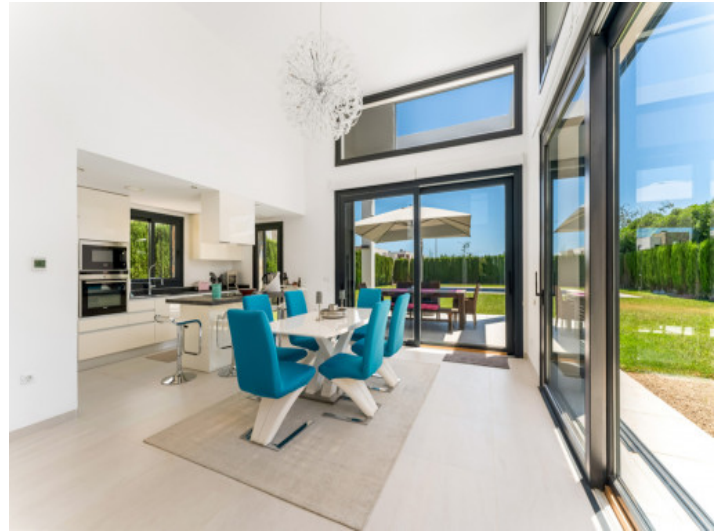
Heller Wohn- und Essbereich

Alle Angaben nach bestem Wissen. Irrtum und Zwischenverkauf vorbehalten. Dieses Exposé ist eine Vorinformation, als Rechtsgrundlage gilt allein der notariell abgeschlossene Kaufvertrag.