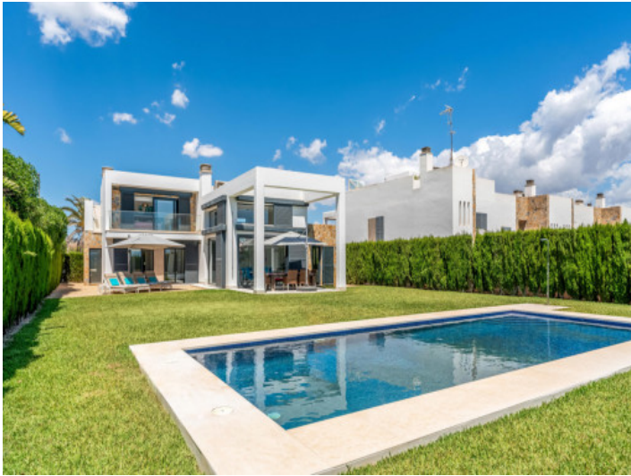
Garten und Pool