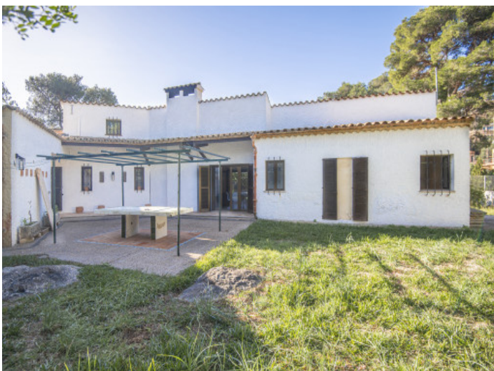
Ideal für Gartenliebhaber