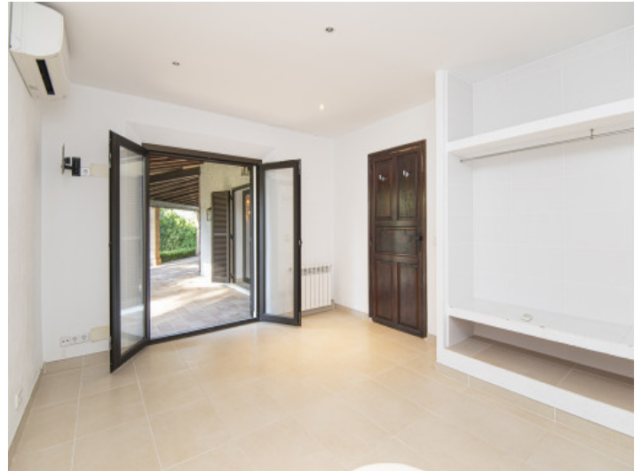
Schlafzimmer mit Terrassenzugang