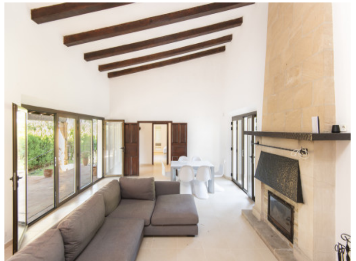
Wohnbereich mit stimmungsvollen Kamin