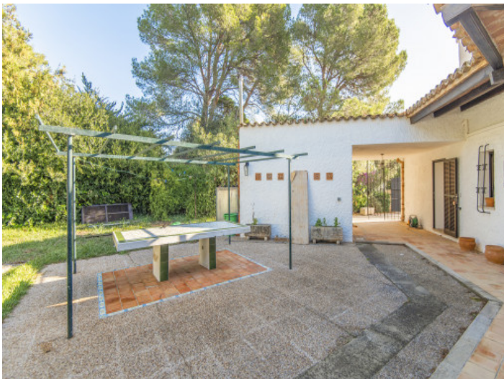
Hintere Bereich des Hauses mit Privatsphäre