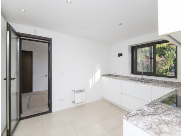
Küche mit Zugangin den Außenbereich