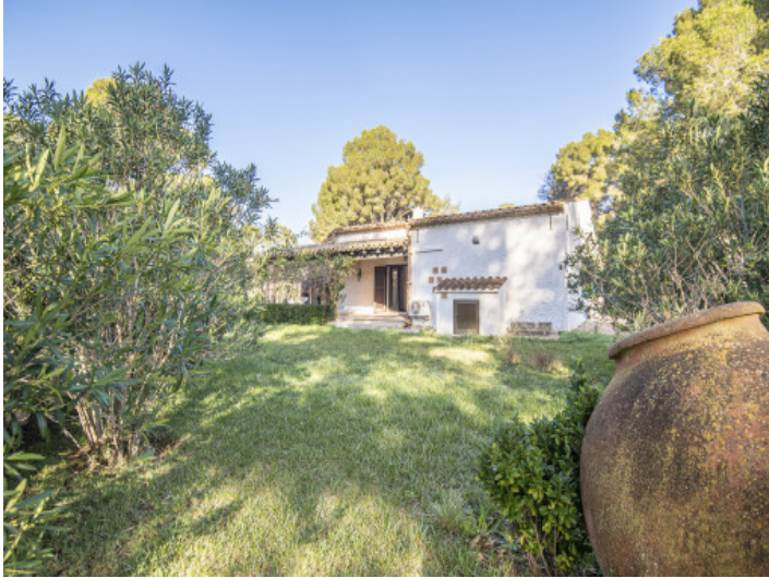
Frontansicht des Hauses