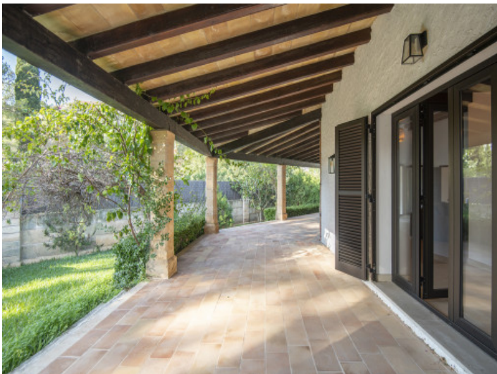
Die überdachte Terrasse ist vom Wohnzimmer aus erreichbar