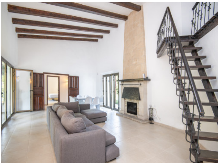
Treppenaufgang zur Schlafgalerie