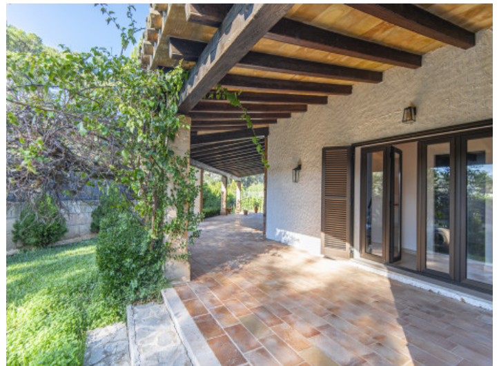
Direkter Gartenzugang von der Terrasse