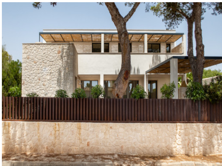
Aussenansicht der Villa