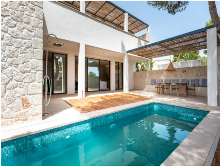
Fassade mit Pool