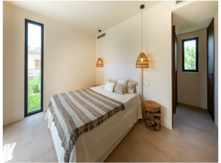
Schlafzimmer mit Bad en Suite