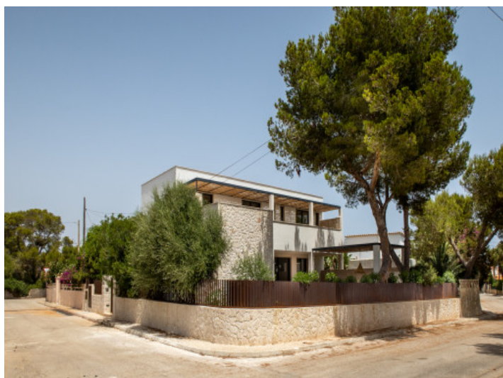
Aussicht auf die Villa