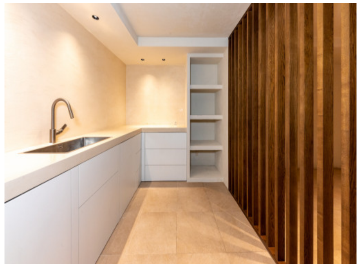
Moderner Hauswirtschaftsraum im Keller

Alle Angaben nach bestem Wissen. Irrtum und Zwischenverkauf vorbehalten. Dieses Exposé ist eine Vorinformation, als Rechtsgrundlage gilt allein der notariell abgeschlossene Kaufvertrag.