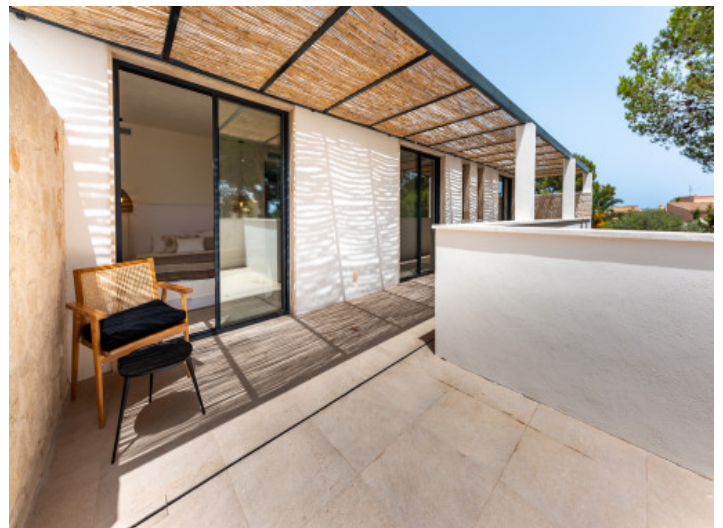
Großer Balkon auf der oberen Etage

Alle Angaben nach bestem Wissen. Irrtum und Zwischenverkauf vorbehalten. Dieses Exposé ist eine Vorinformation, als Rechtsgrundlage gilt allein der notariell abgeschlossene Kaufvertrag.