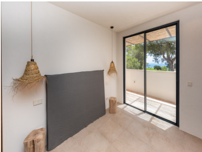
Schlafzimmer mit direktem Zugang zur Terrasse