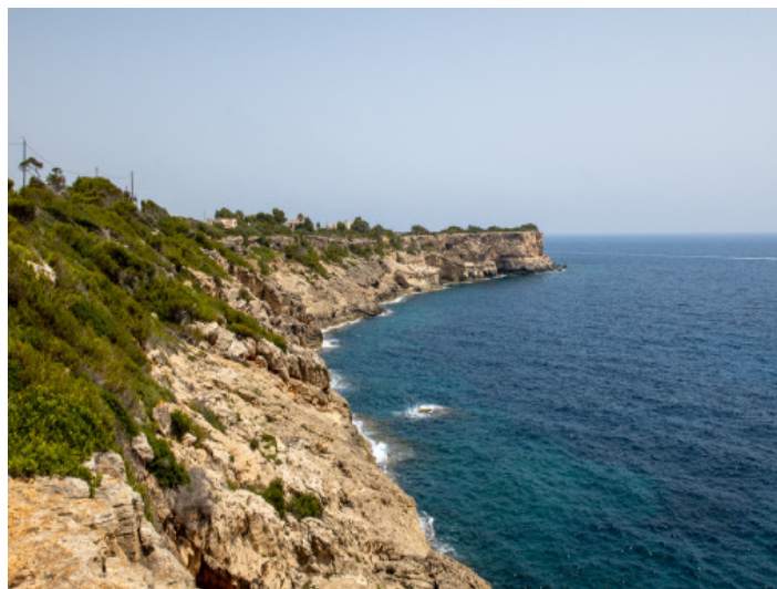
Küstenabschnitt bei S'Amarador