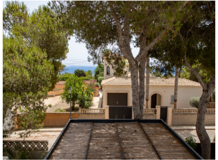
Dieses Traumhaus ist sehr Strandnah