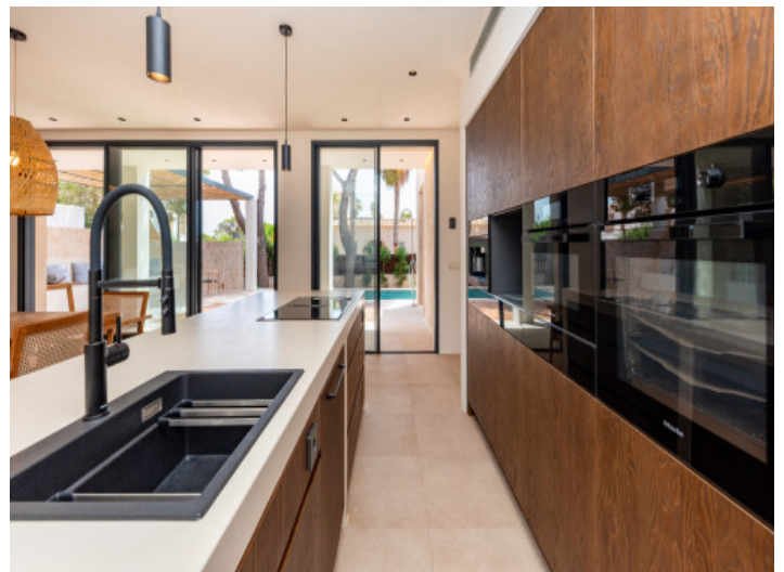
Moderne Küche mit Kochinsel

Alle Angaben nach bestem Wissen. Irrtum und Zwischenverkauf vorbehalten. Dieses Exposé ist eine Vorinformation, als Rechtsgrundlage gilt allein der notariell abgeschlossene Kaufvertrag.