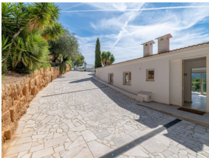
Fassade der am Hang liegenden Villa

Alle Angaben nach bestem Wissen. Irrtum und Zwischenverkauf vorbehalten. Dieses Exposé ist eine Vorinformation, als Rechtsgrundlage gilt allein der notariell abgeschlossene Kaufvertrag.