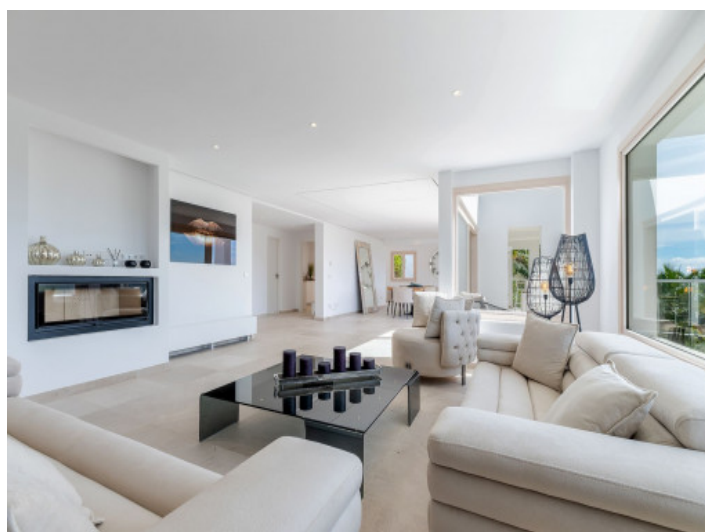
Gemütlicher Wohnbereich mit Gaskamin

Alle Angaben nach bestem Wissen. Irrtum und Zwischenverkauf vorbehalten. Dieses Exposé ist eine Vorinformation, als Rechtsgrundlage gilt allein der notariell abgeschlossene Kaufvertrag.