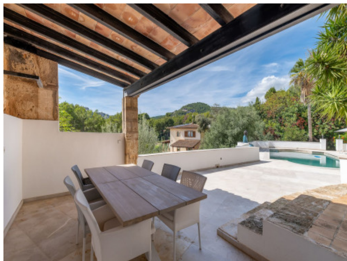
Überdachte Veranda am Poolbereich