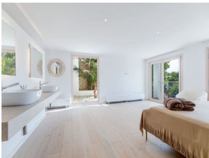
Schlafzimmer mit Bad en Suite