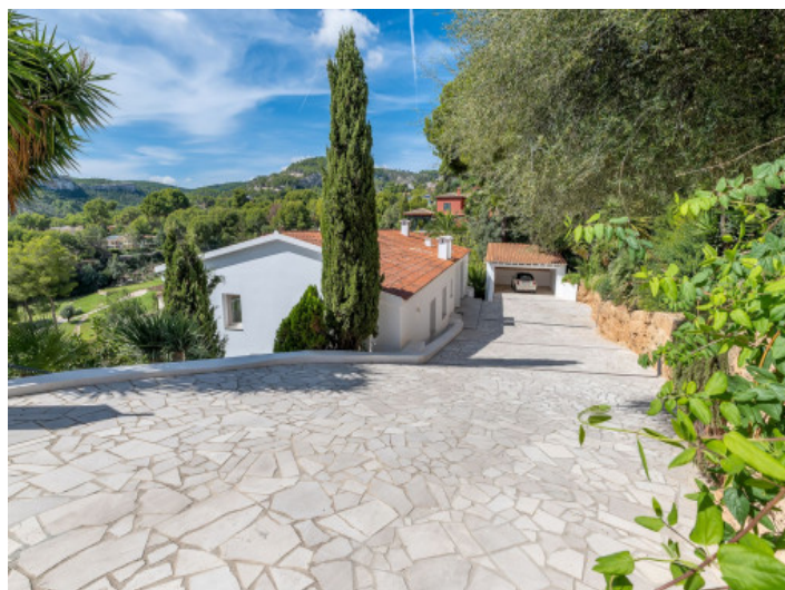
Einfahrt zur Villa

Alle Angaben nach bestem Wissen. Irrtum und Zwischenverkauf vorbehalten. Dieses Exposé ist eine Vorinformation, als Rechtsgrundlage gilt allein der notariell abgeschlossene Kaufvertrag.