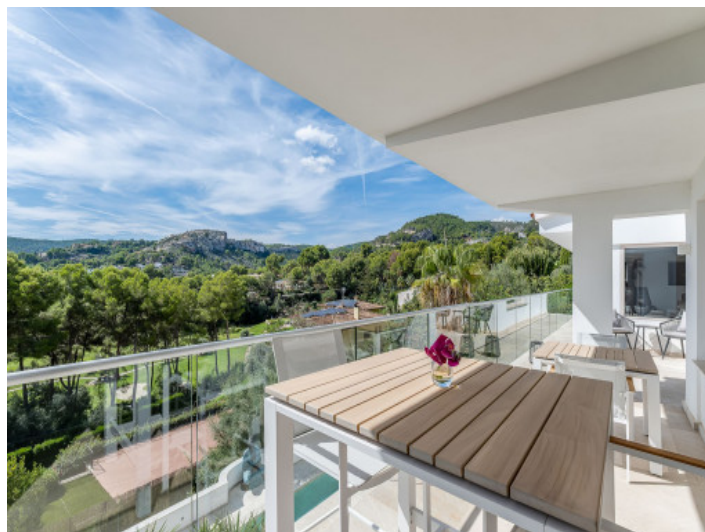
Terrasse mit Traumblick über das Green von Son Vida Golf