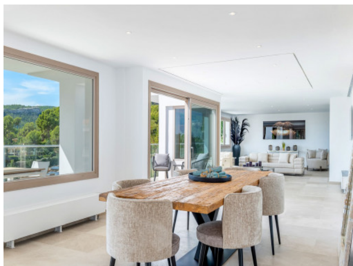
Heller Wohn und Essbereich