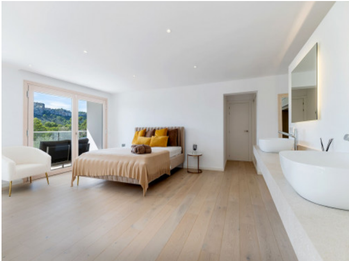
Eines von 6 Schlafzimmern