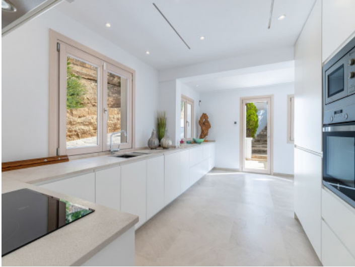
Die moderne Küche