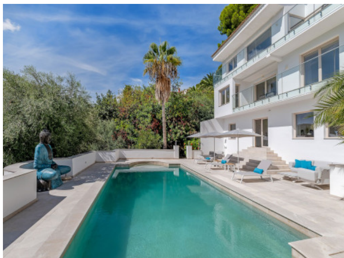
Ansicht auf die Villa