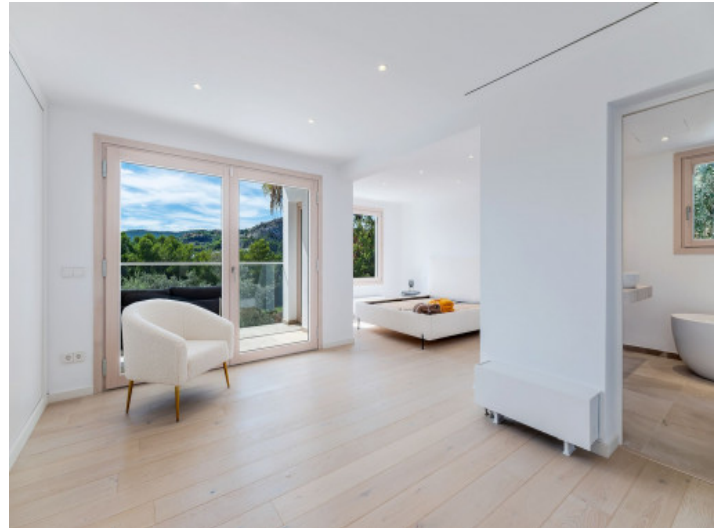
Ein weiteres komfortables Schlafzimmer