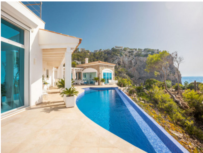
Inifintypool mit Meerblick