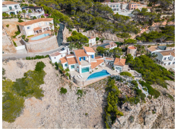
Villa aus der Vogelperspektive