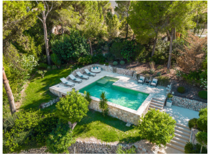
Pooloase inmitten eines grünen Gartens