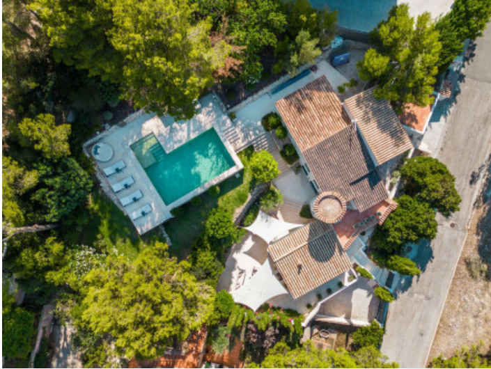
Blick von oben