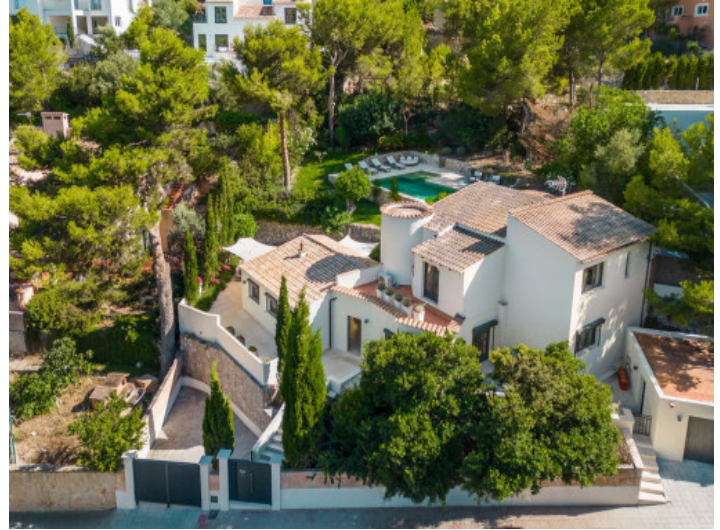
Blick von der Straße