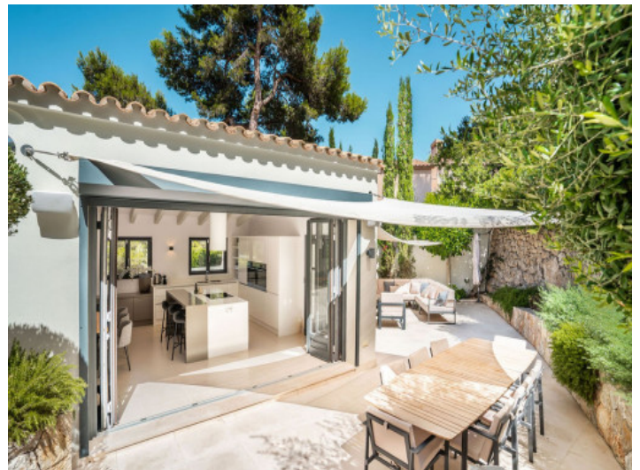
Schöner Essbereich im Freien