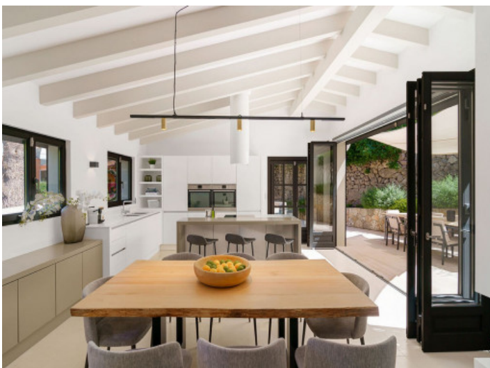
Weiter Zugang zur Küche