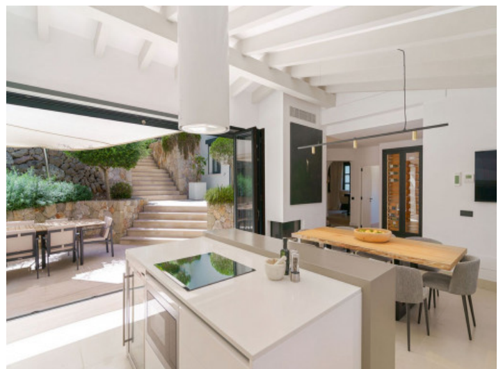
Moderne, offene Küche

Alle Angaben nach bestem Wissen. Irrtum und Zwischenverkauf vorbehalten. Dieses Exposé ist eine Vorinformation, als Rechtsgrundlage gilt allein der notariell abgeschlossene Kaufvertrag.