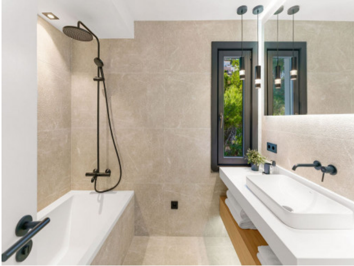
Eines von 4 Badezimmern