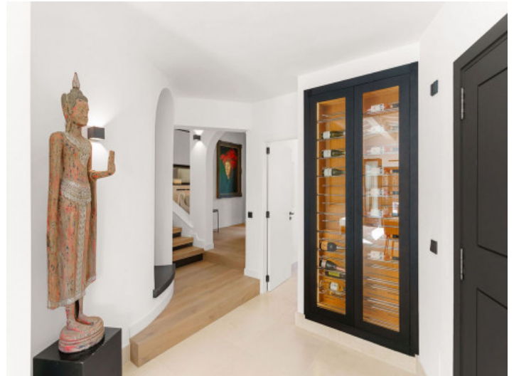
Flur mit Weinkühler