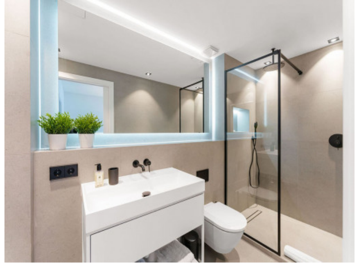
Eines von 4 Badezimmern