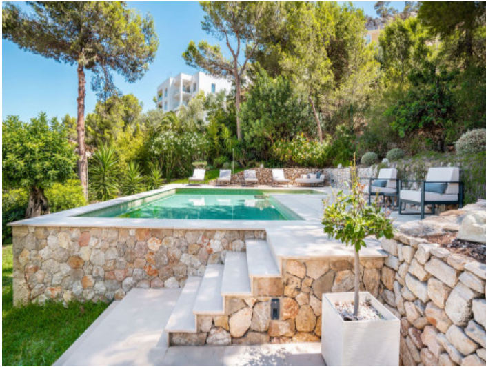
Wundervoll angelegter Außenbereich