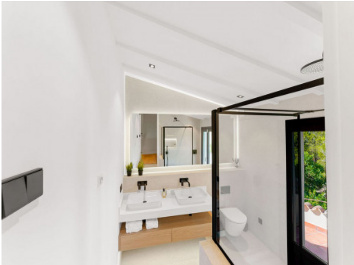
Eines von 4 Badezimmern