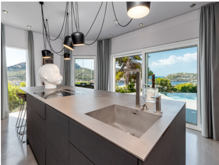
Die Küche verfügt über eine Kochinsel