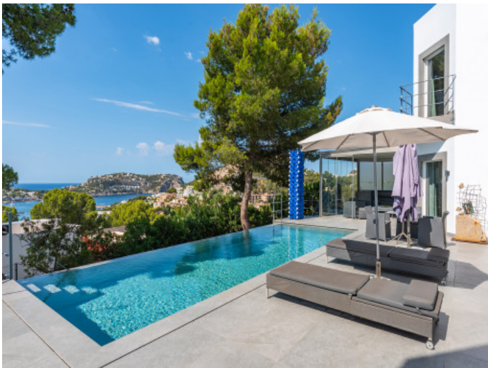
Terrasse mit Poolbereich