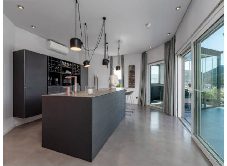
Küche mit direktem Terrassenzugang