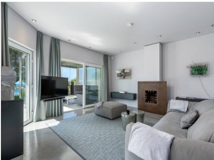
Wohnbereich mit bodentiefen Fenstern