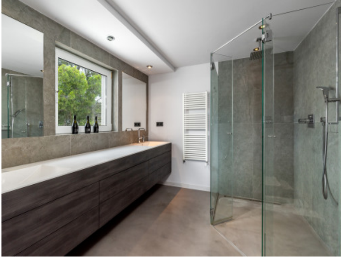
Badzimmer mit begehbare Dusche