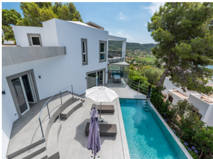
Terrasse mit Poolbereich