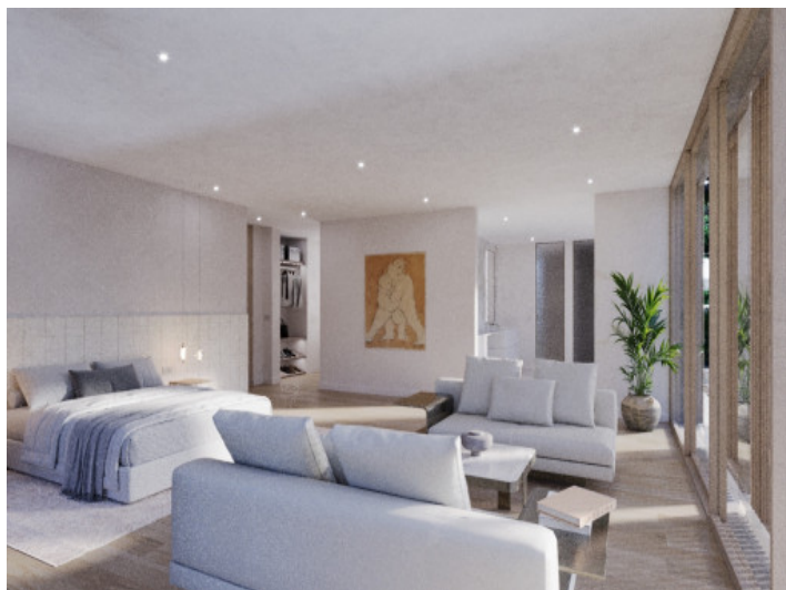
Wunderschönes Schlafzimmer mit Sitzgelegenheit