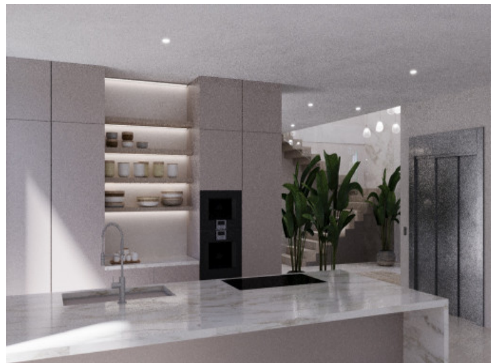
Moderne, amerikanische Küche

Alle Angaben nach bestem Wissen. Irrtum und Zwischenverkauf vorbehalten. Dieses Exposé ist eine Vorinformation, als Rechtsgrundlage gilt allein der notariell abgeschlossene Kaufvertrag.