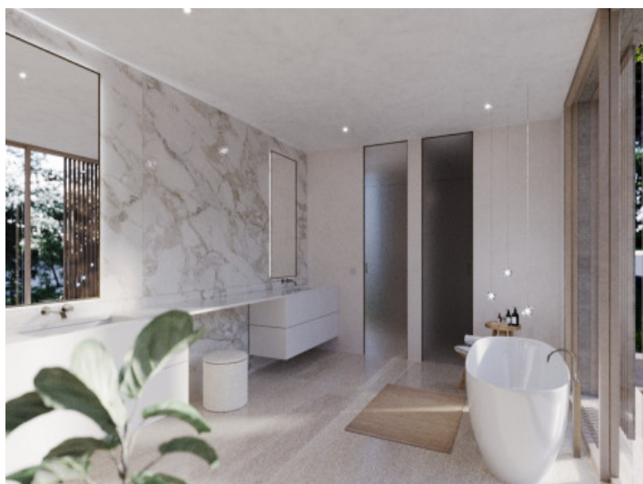
Badezimmer im minimalistischen Design