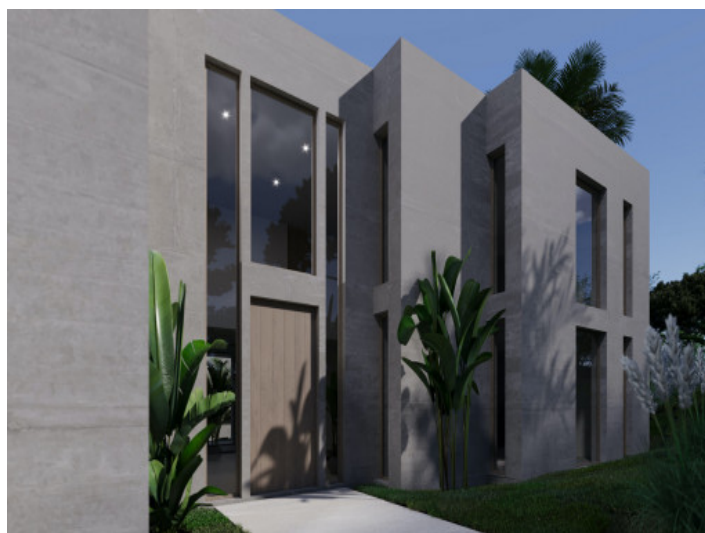
Fassade der Villa

Alle Angaben nach bestem Wissen. Irrtum und Zwischenverkauf vorbehalten. Dieses Exposé ist eine Vorinformation, als Rechtsgrundlage gilt allein der notariell abgeschlossene Kaufvertrag.