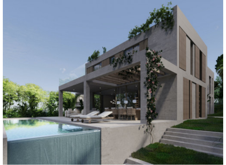
Weitere Ansicht des Bauprojektes