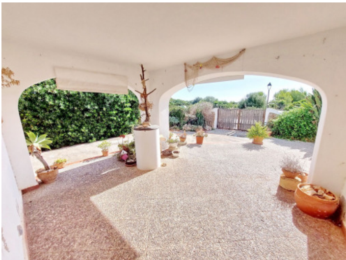
Große, überdachte Terrasse