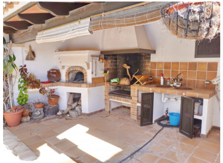
Rustikaler Bbq Bereich