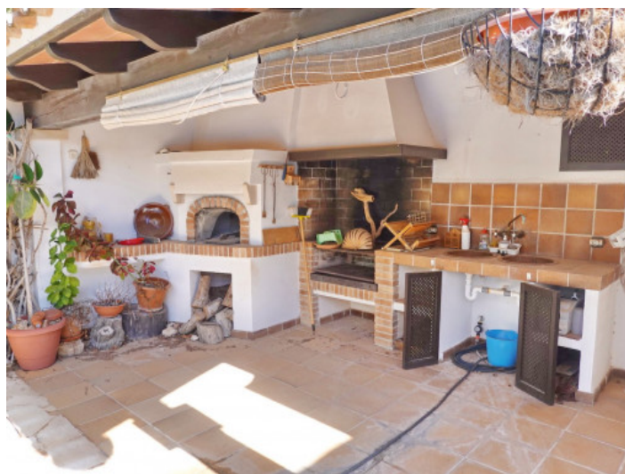
Rustikaler Bbq Bereich