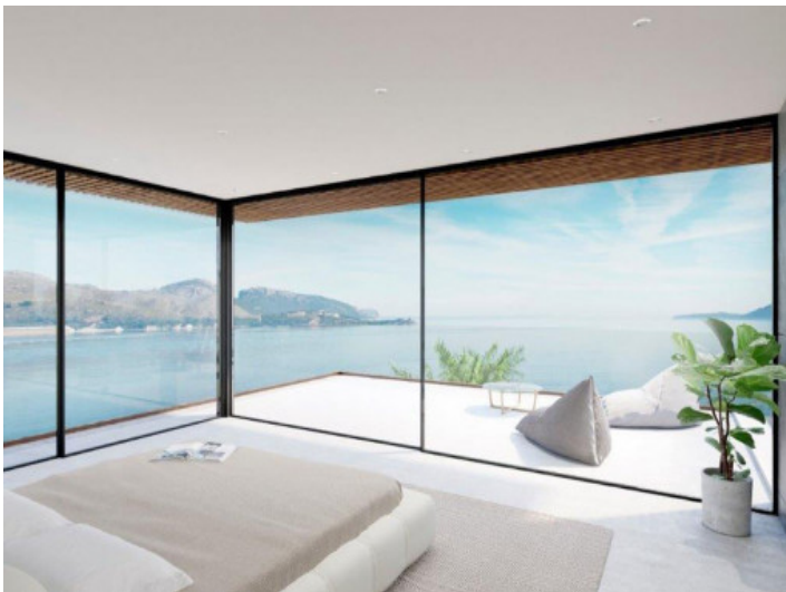
Schlafzimmer mit Panorama-Meerblick