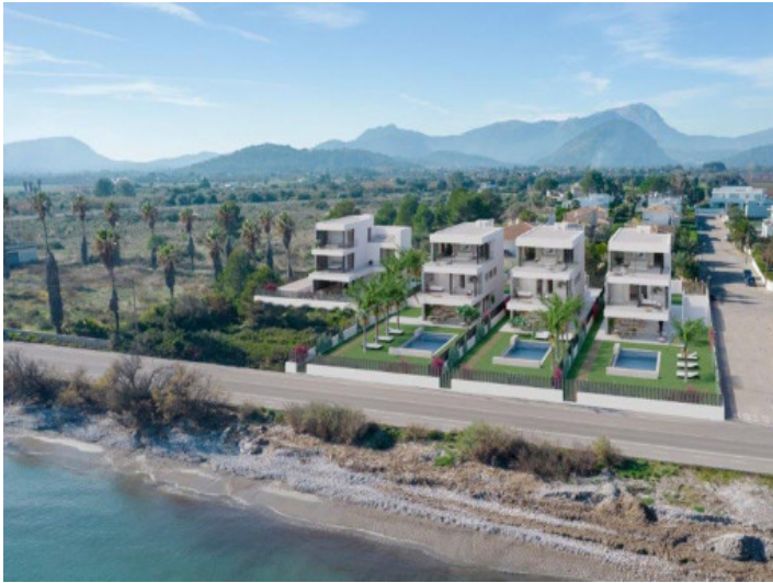
Villa in erster Meereslinie