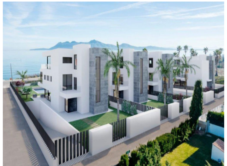
Blick von der Straße

Alle Angaben nach bestem Wissen. Irrtum und Zwischenverkauf vorbehalten. Dieses Exposé ist eine Vorinformation, als Rechtsgrundlage gilt allein der notariell abgeschlossene Kaufvertrag.