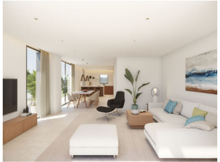
Alternative Ansicht des Wohnbereichs