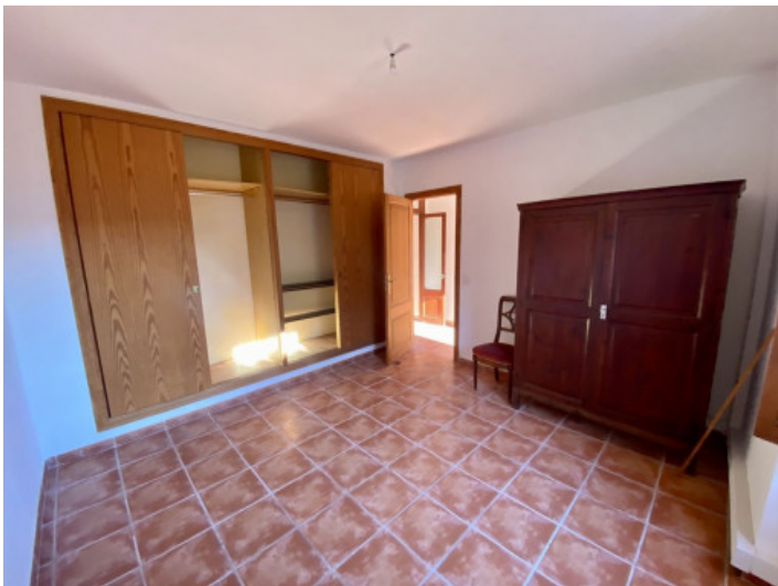
eines von 3 Schlafzimmern