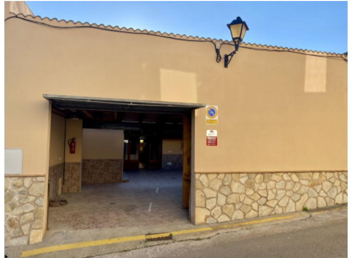
Einfahrt zum Innenhof

Alle Angaben nach bestem Wissen. Irrtum und Zwischenverkauf vorbehalten. Dieses Exposé ist eine Vorinformation, als Rechtsgrundlage gilt allein der notariell abgeschlossene Kaufvertrag.