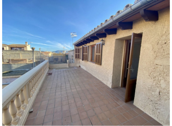
Terrasse im OG