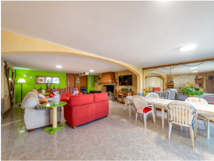
Wohn- und Essbereich