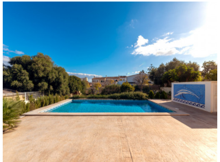
Pool und Terrasse