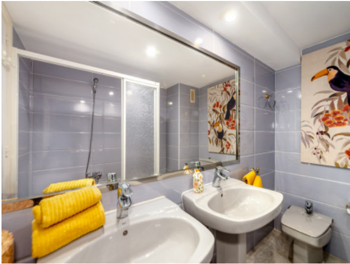
Ein weiteres Badezimmer