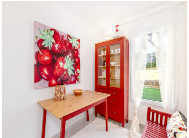
Das 4. Schlafzimmer