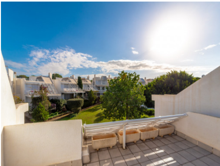
Terrasse mit Weitblick