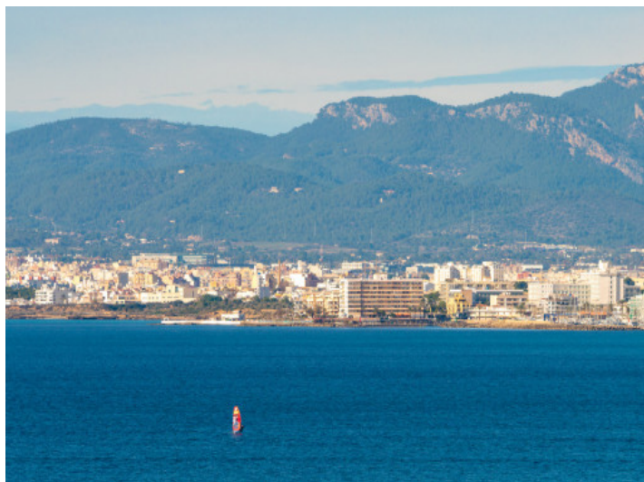
Fernblick auf die Bucht von Palma