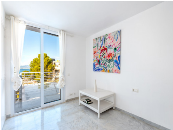
Ein weiteres Schlafzimmer