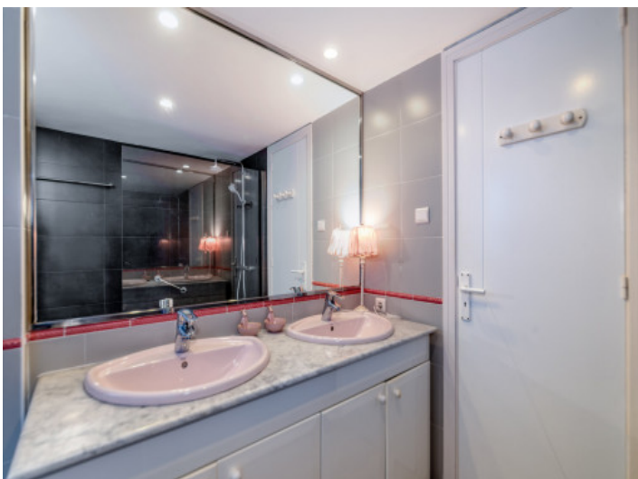
Reihenhaus mit 4 Badezimmern