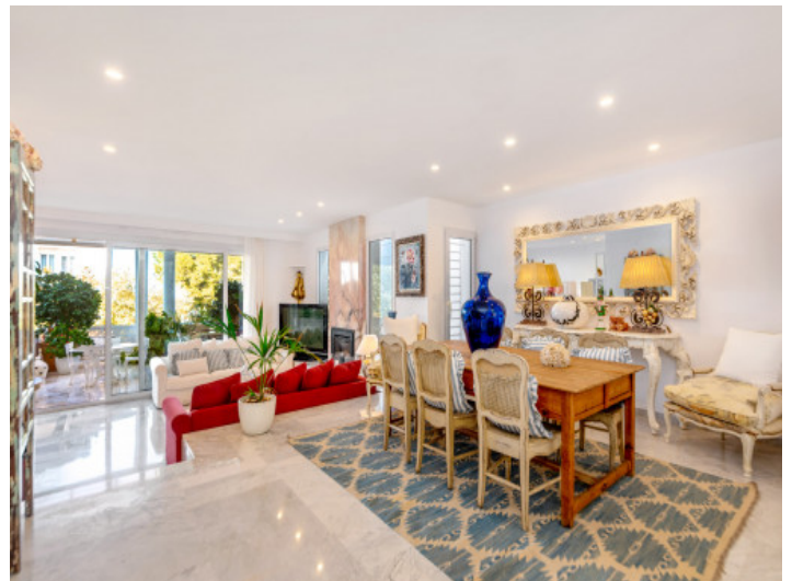
Eleganter Wohn- und Essbereich