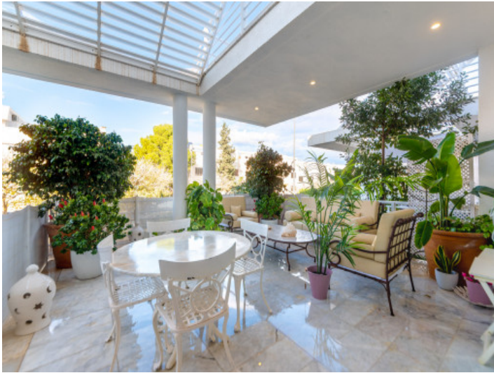
Schöner großer Balkon