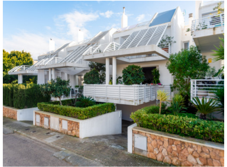
Frontfassade und Parkplatz