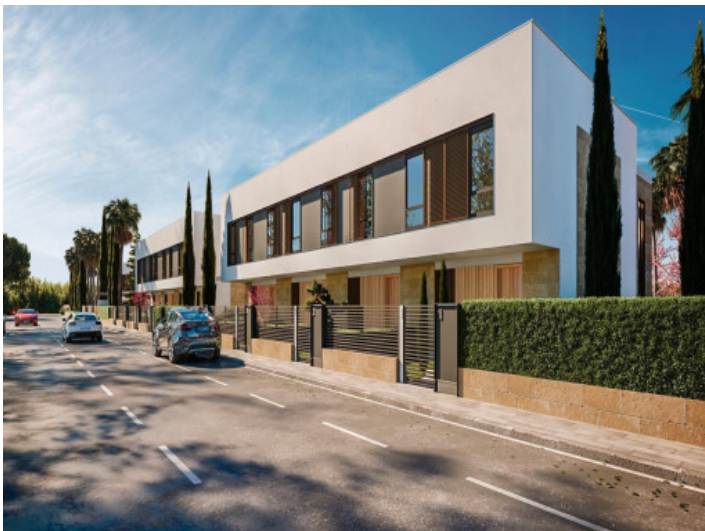
Ansicht auf das Haus