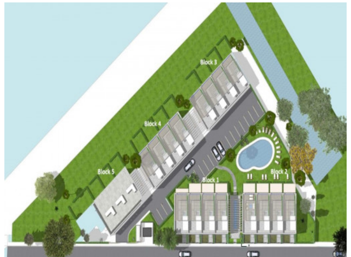
Plan der Wohnanlage

Alle Angaben nach bestem Wissen. Irrtum und Zwischenverkauf vorbehalten. Dieses Exposé ist eine Vorinformation, als Rechtsgrundlage gilt allein der notariell abgeschlossene Kaufvertrag.