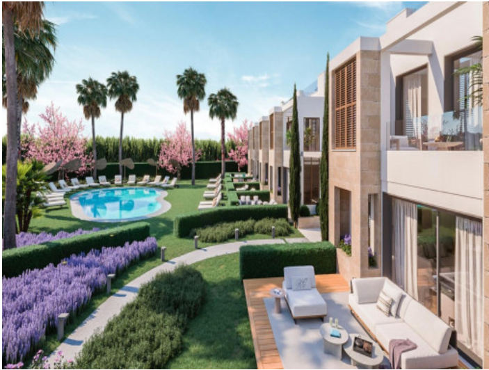
Privater Garten und Gemeinschaftspool