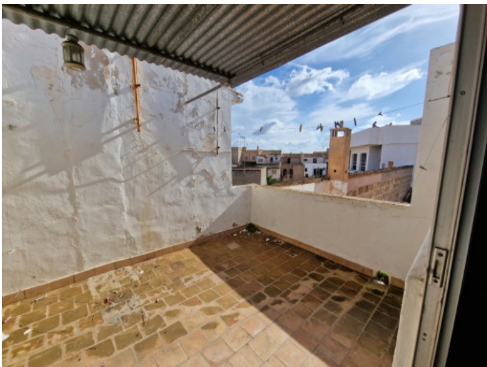
Dachterasse mit Weitblick