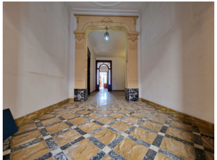
Eingangsbereich mit original Fußboden