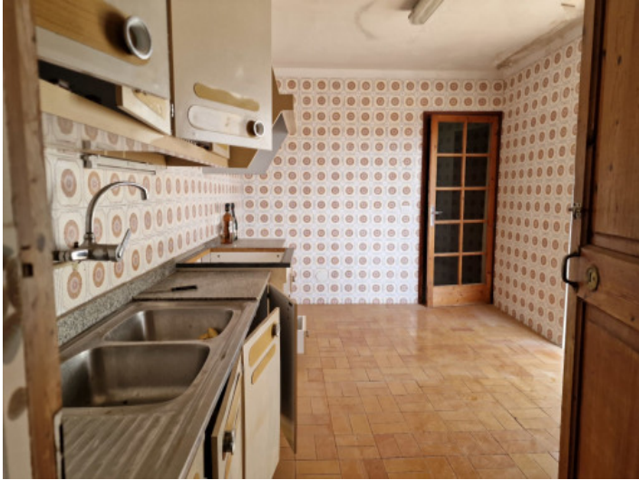
Helle Küche mit Vinatge Fliesen