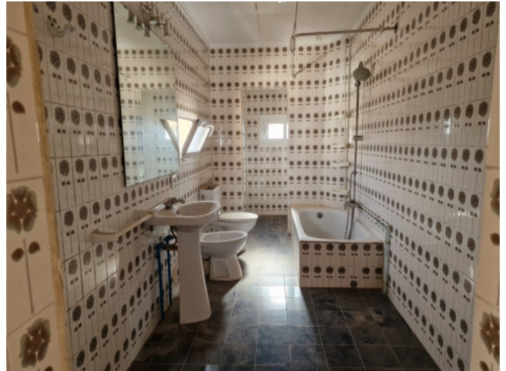
Eines von 4 Badezimmern