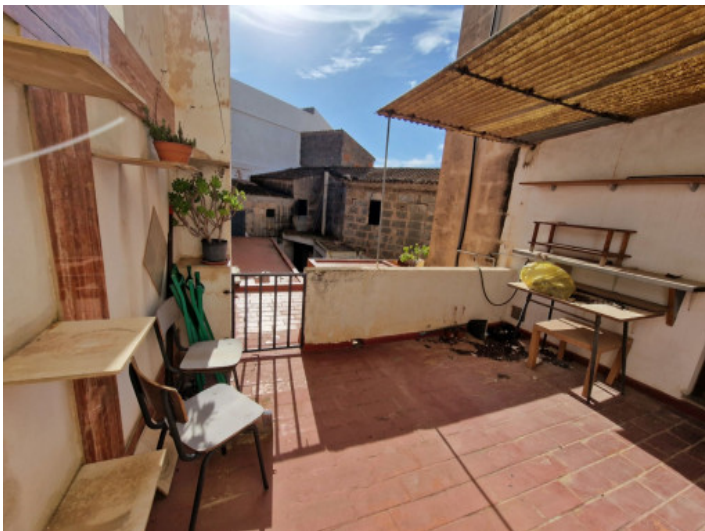
Terrasse im 1. Stock