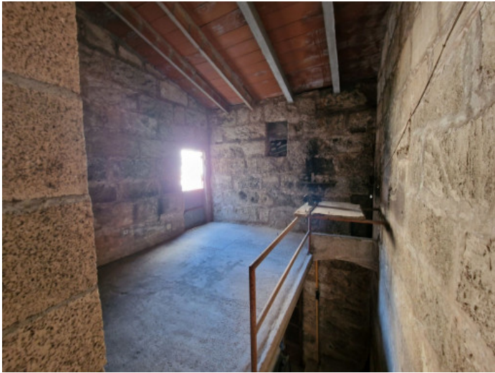
Ausbaufähiger Raum über der Garage