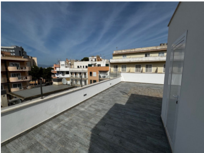
Weitere Ansicht der Dachterrasse