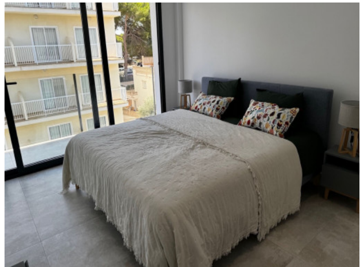
Wunderschön gestaltetes Doppelschlafzimmer