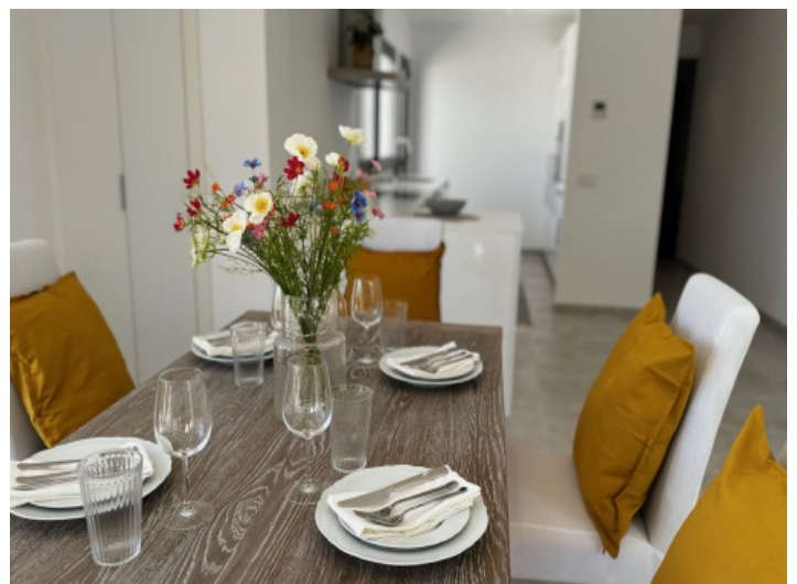
Detailansicht des Essbereichs

Alle Angaben nach bestem Wissen. Irrtum und Zwischenverkauf vorbehalten. Dieses Exposé ist eine Vorinformation, als Rechtsgrundlage gilt allein der notariell abgeschlossene Kaufvertrag.