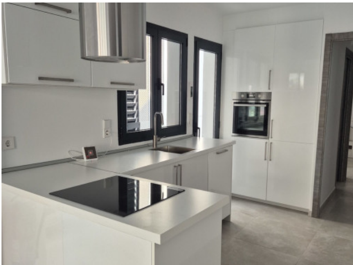
Komplett ausgestattete Küche