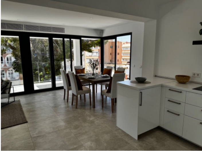
Offene Küche und Essbereich