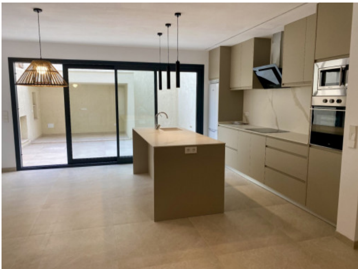
Küche mit Zugang zum Patio