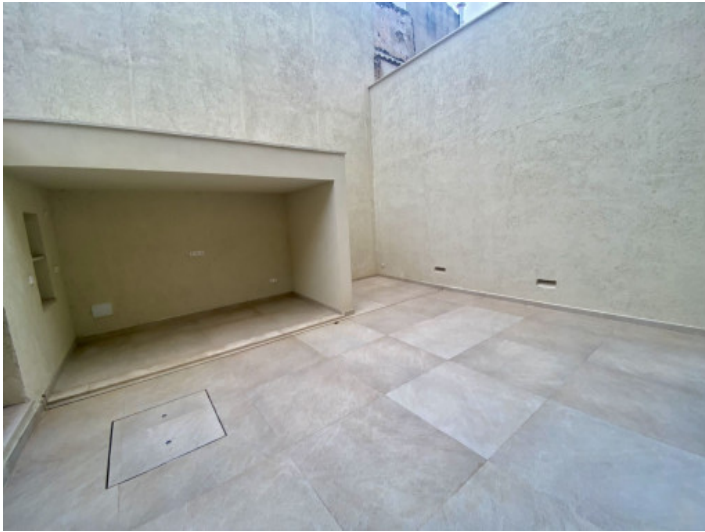
Innenhof mit viel Platz