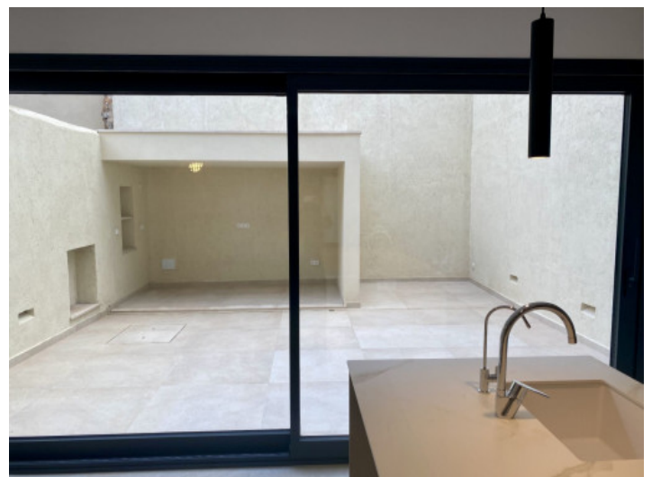
Aussicht auf den Patio

Alle Angaben nach bestem Wissen. Irrtum und Zwischenverkauf vorbehalten. Dieses Exposé ist eine Vorinformation, als Rechtsgrundlage gilt allein der notariell abgeschlossene Kaufvertrag.