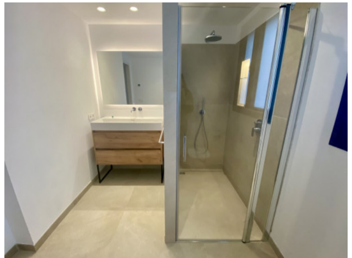
Haus mit 2 Badezimmern

Alle Angaben nach bestem Wissen. Irrtum und Zwischenverkauf vorbehalten. Dieses Exposé ist eine Vorinformation, als Rechtsgrundlage gilt allein der notariell abgeschlossene Kaufvertrag.