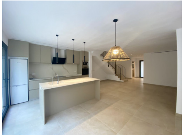
Küche und Wohnbereich