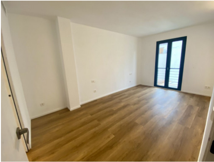
Stadthaus mit 2 Schlafzimmern