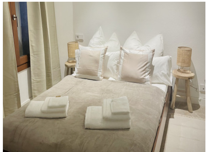
Eines der 3 Schlafzimmer

Alle Angaben nach bestem Wissen. Irrtum und Zwischenverkauf vorbehalten. Dieses Exposé ist eine Vorinformation, als Rechtsgrundlage gilt allein der notariell abgeschlossene Kaufvertrag.