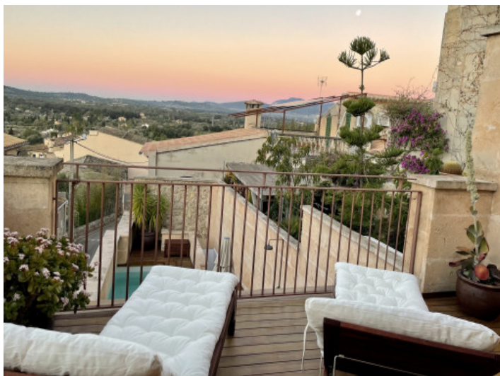
Atemberaubender Blick in Abendstimmung