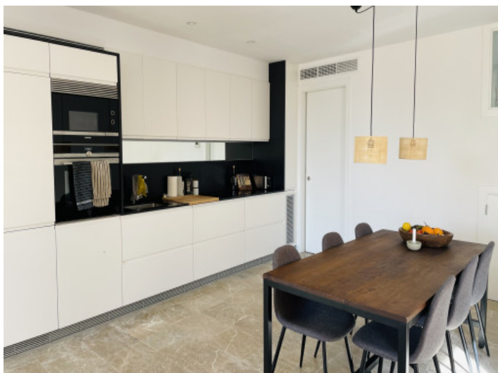
Moderne, voll ausgestattete Küche und Essbereich