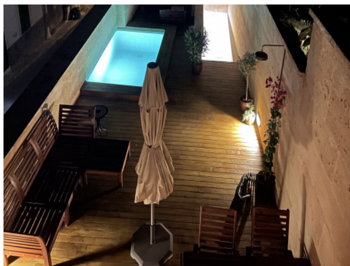
Terrasse und Pool