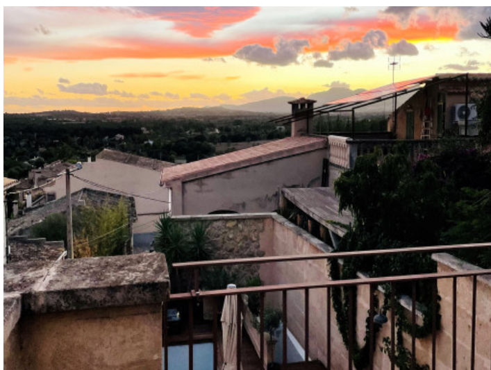
Weitblick über Buger