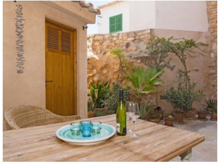
Stadthaus mit Patio