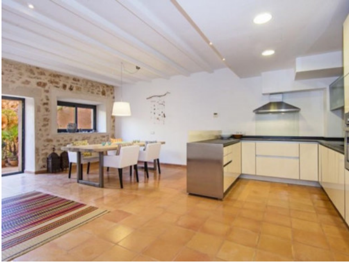
Offene und moderne Küche