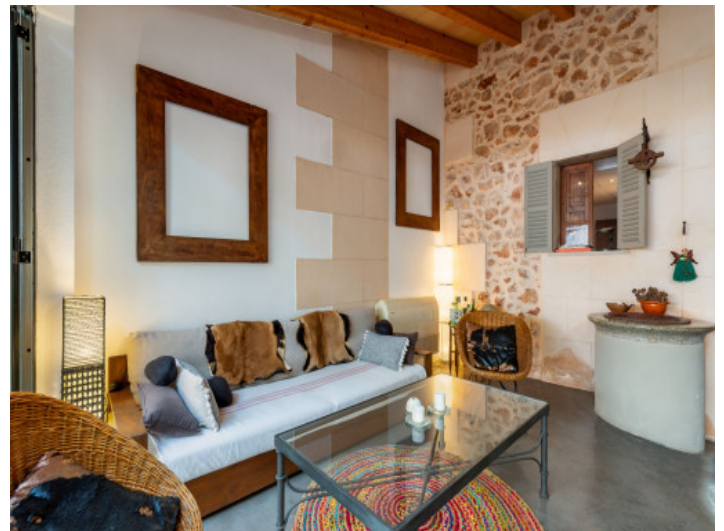
Weitere Ansicht des Wohnbereiches