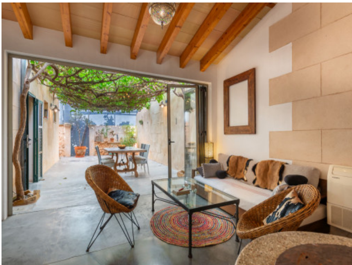
Wohnbereich mit Patiozugang