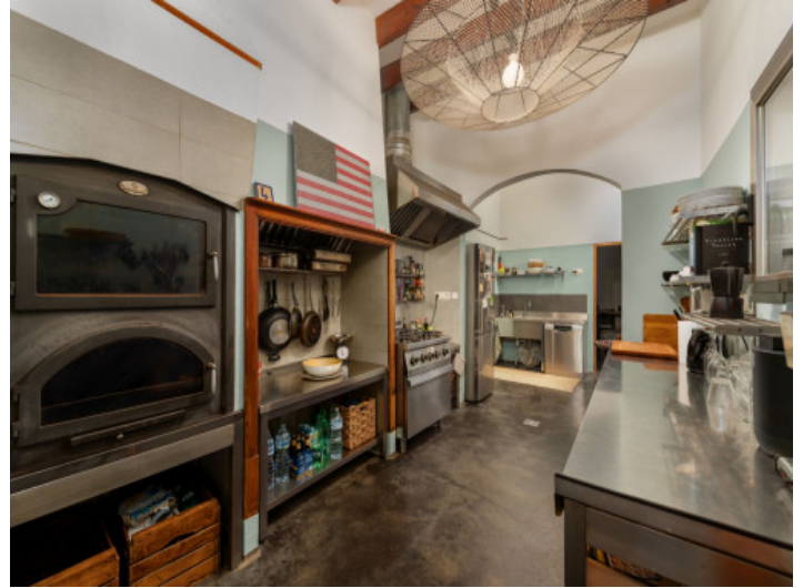
Küche im industriellen Stil