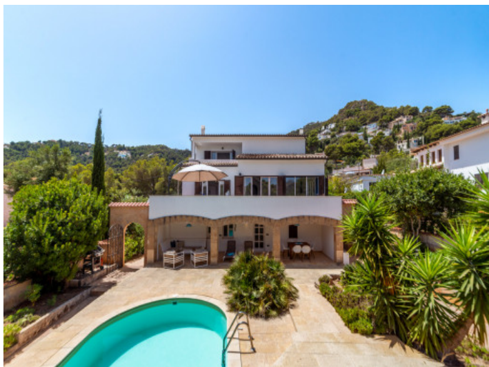
Ansicht auf das Haus