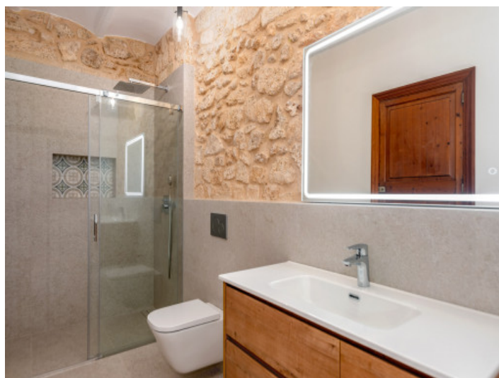
Ein weiteres Badezimmer