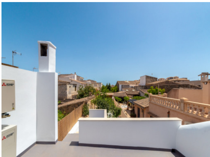
Dachterrasse mit Blick über die Nachbarschaft