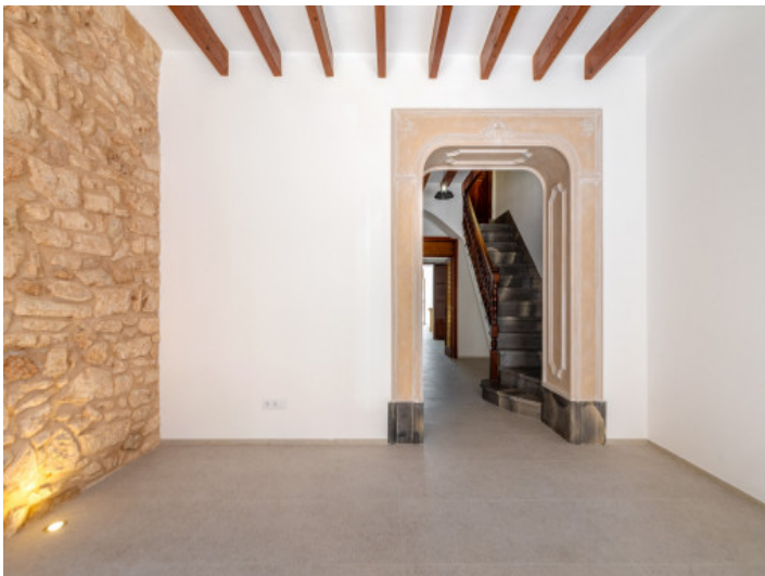
Wohnbereich und Treppenaufgang