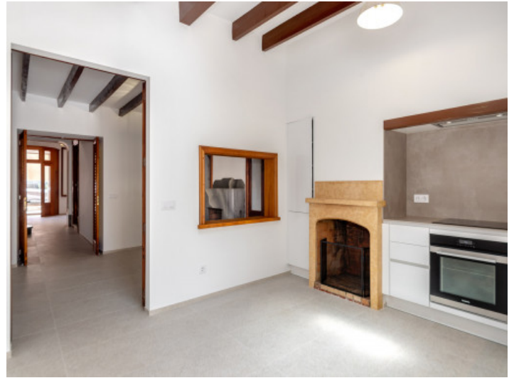
Blick von der Küche in den Wohnbereich 9