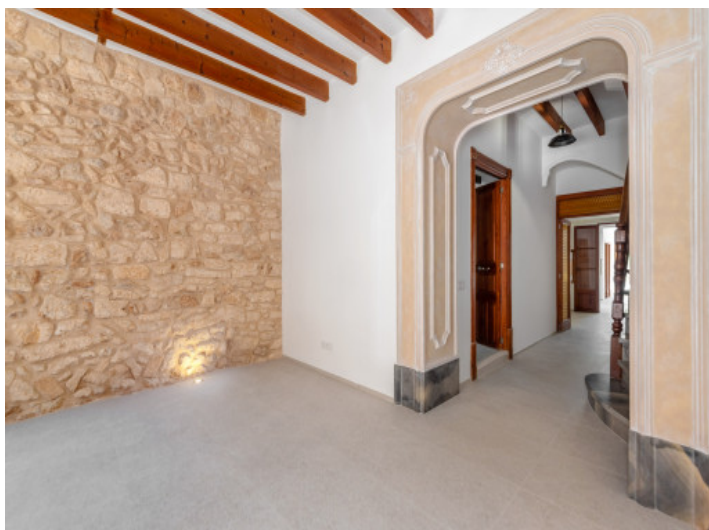
Wohnbereich mit Natursteinwand