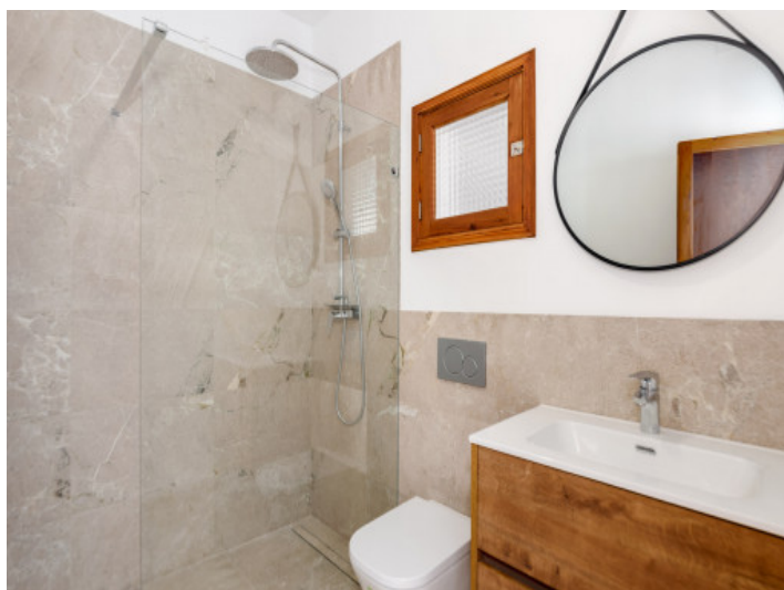
Badezimmer mit bodentiefer Dusche