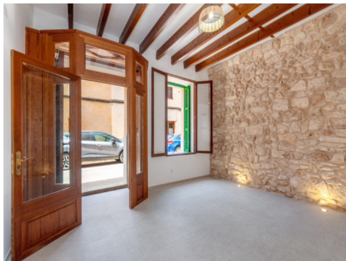
Typisch mallorquinischer Eingangsbereich