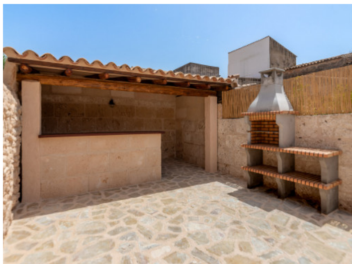
Grillbereich im Patio