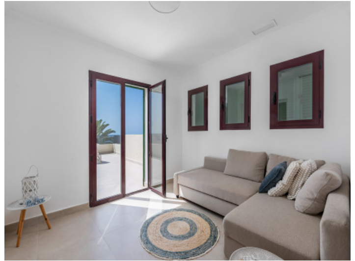
Wohnbereich 1. Stock