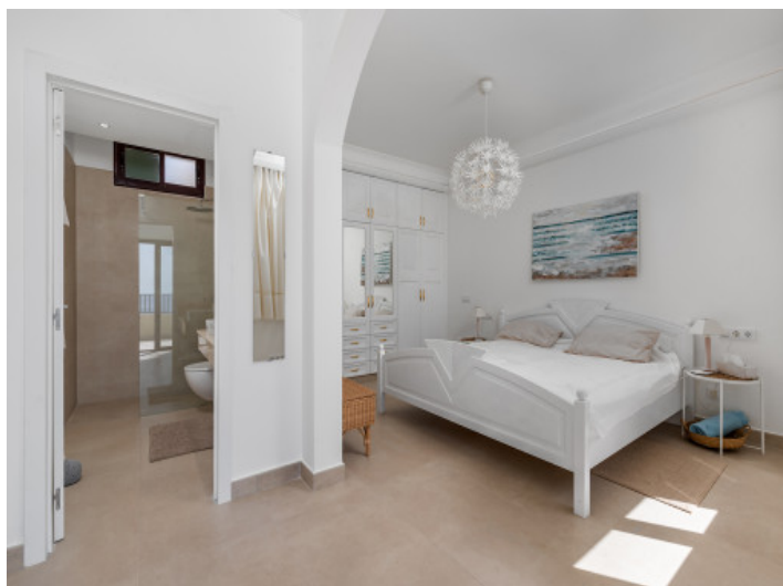
Schlafzimmer 1. Stock