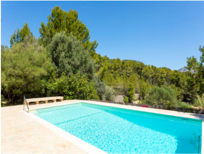
Ruhiges freistehendes Einfamilienhaus mit Potential in Es Capdellà