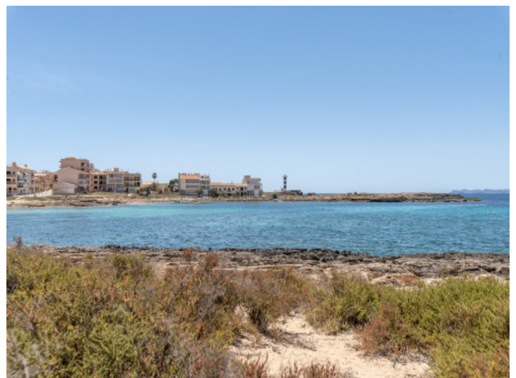
Colonia St. Jordi

Alle Angaben nach bestem Wissen. Irrtum und Zwischenverkauf vorbehalten. Dieses Exposé ist eine Vorinformation, als Rechtsgrundlage gilt allein der notariell abgeschlossene Kaufvertrag.