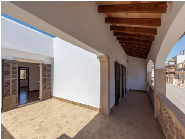
Obere Etage mit weitläufiger Terrasse