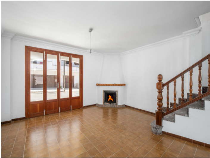
Eingangsbereich mit Kamin