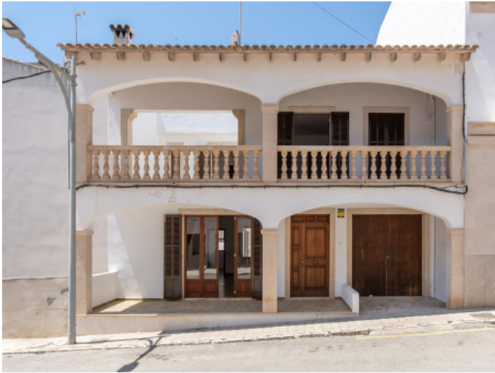
Fassade im mallorquinischem Stil