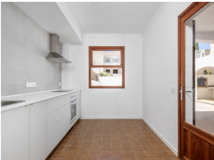
Küche mit direktem Anschluss an die Terrasse