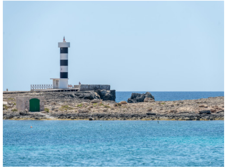
Leuchtturm Cala Gaviota