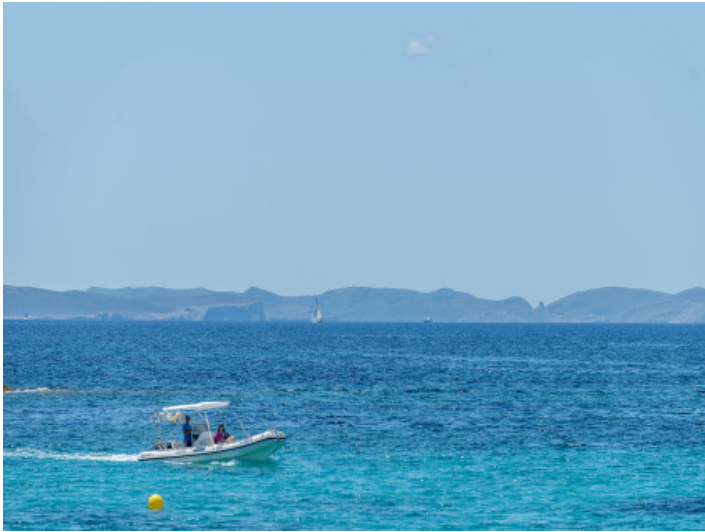
Weitblick vom Strand bis nach Cabrera