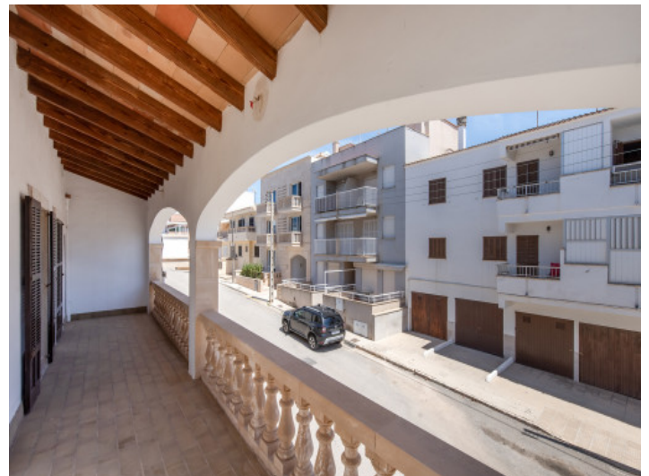
Ausblick auf die Nachbarschaft