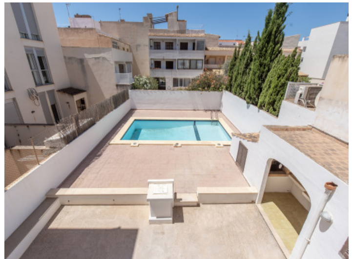
Aussicht auf den Patio