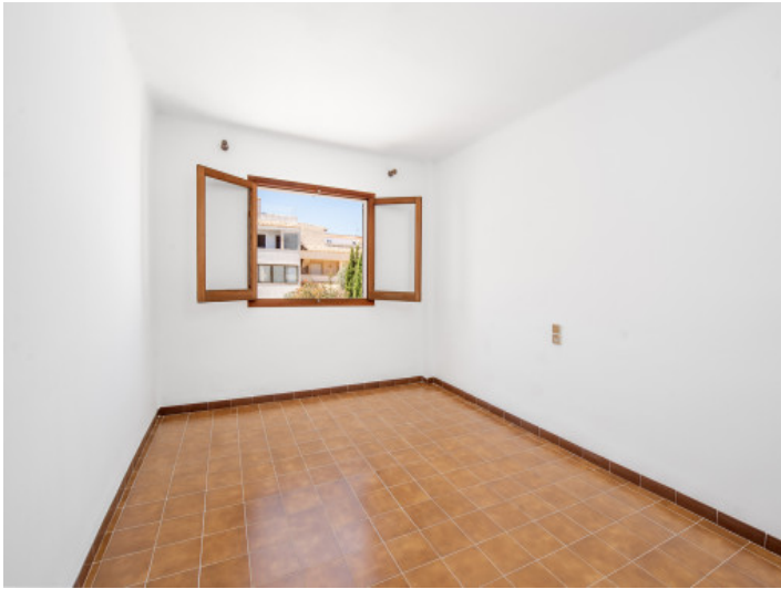
Eines von 5 Schlafzimmer