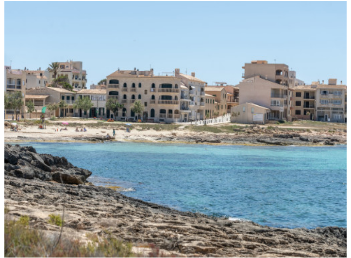
Cala Gaviota ist in unmittelbarer Nähe