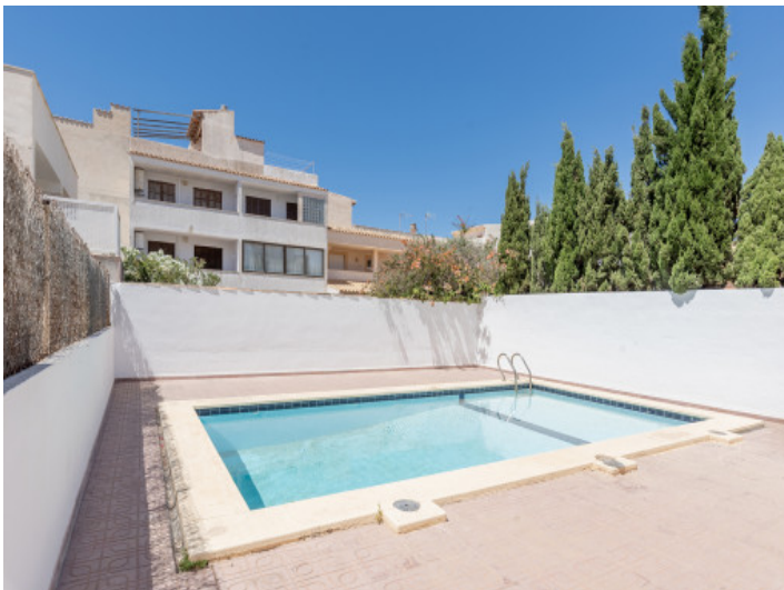
Innenhof mit Pool