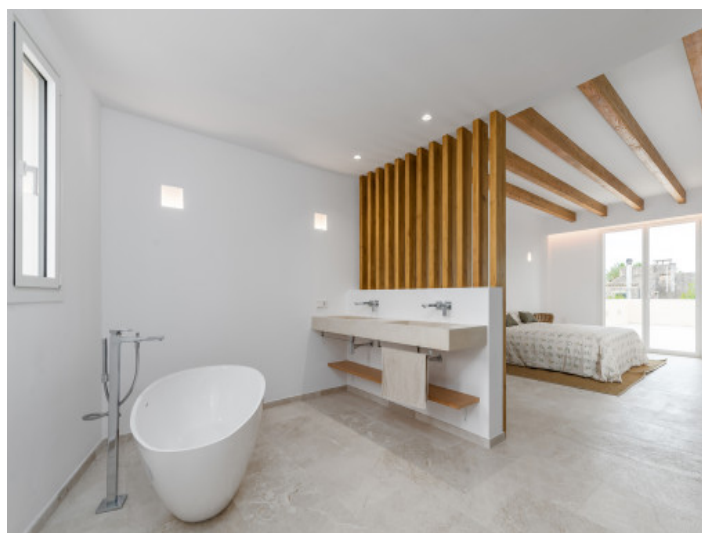
Mastersuit mit Badezimmer