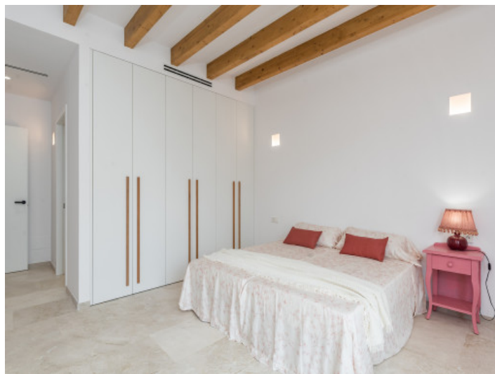
Alle Schlafzimmer mit Badezimmer en Suite