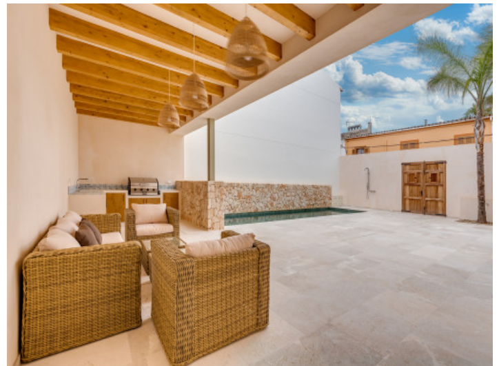
Überdachte Terrasse im Innenhof