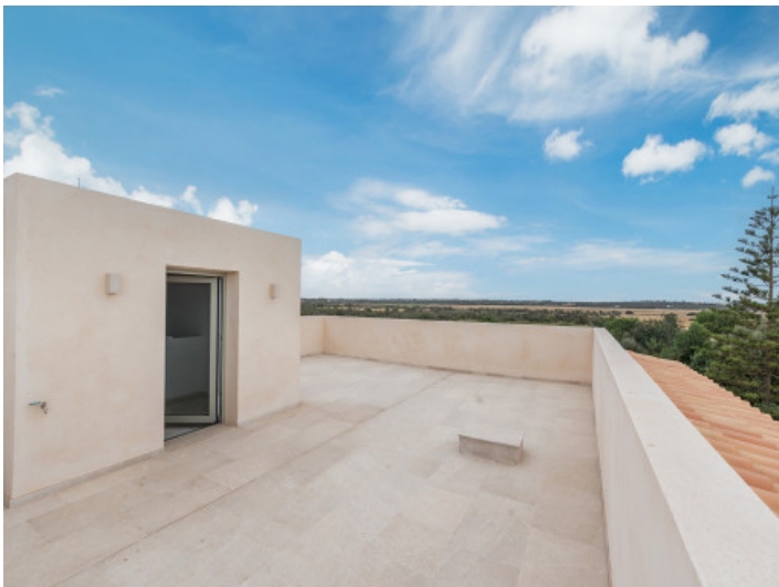
Terrasse im Obergeschoss