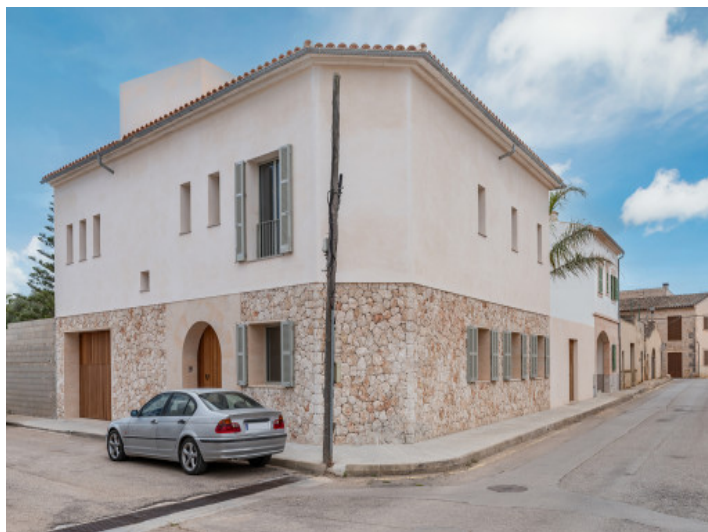
Ansicht auf das Stadthaus