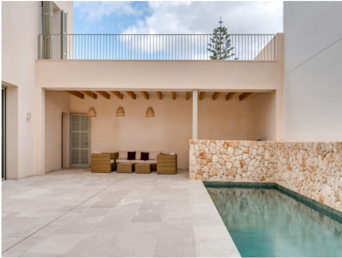
Patio mit Pool