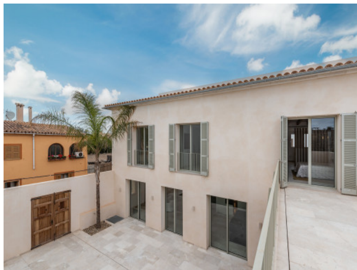
Fantastischer Innenhof mit Privatsphäre