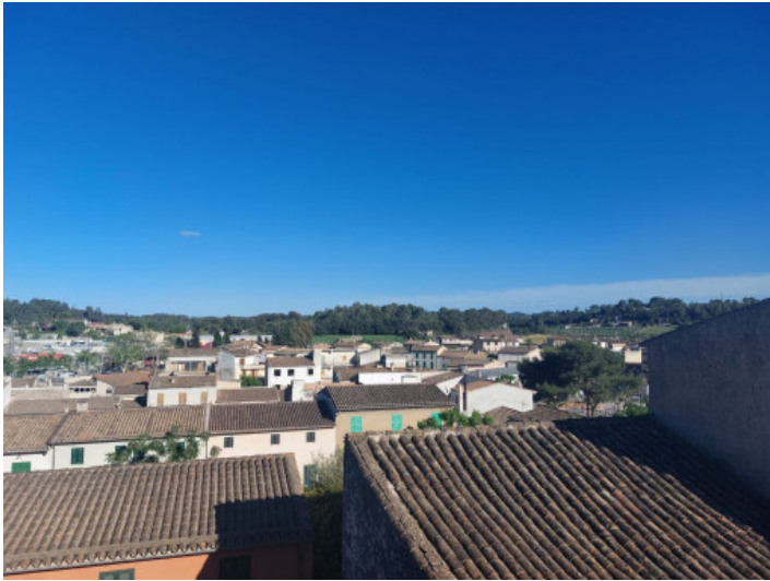
Ausblick vom Obergeschoss