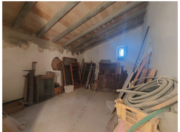
Einer der Räume