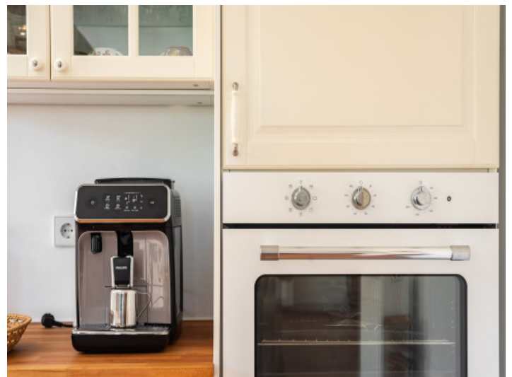
Details der Küche