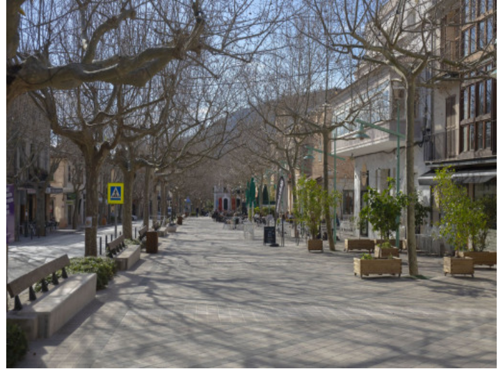
Boulevard in Esporles