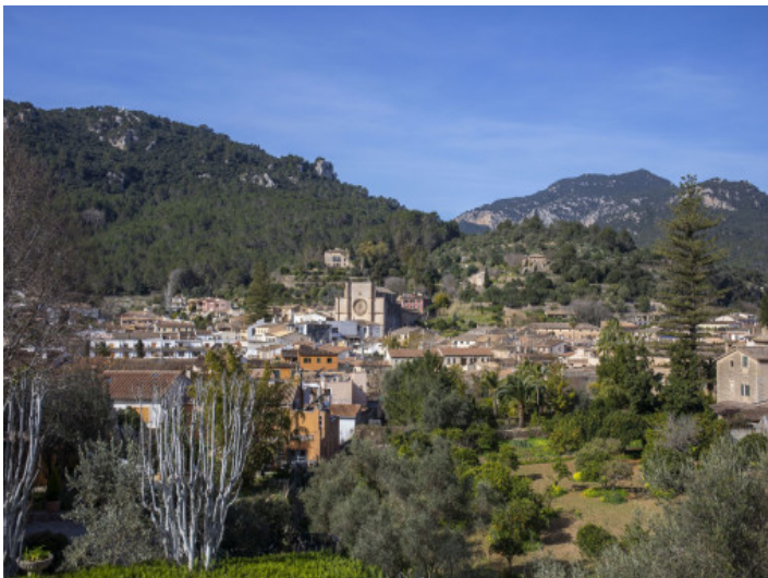
Inselfeeling am Fuss der Berge