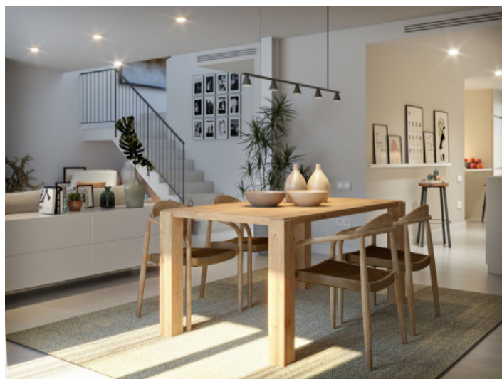
Wohn und Essbereich

Alle Angaben nach bestem Wissen. Irrtum und Zwischenverkauf vorbehalten. Dieses Exposé ist eine Vorinformation, als Rechtsgrundlage gilt allein der notariell abgeschlossene Kaufvertrag.