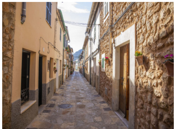
Malerische kleine Straße im Ort

Alle Angaben nach bestem Wissen. Irrtum und Zwischenverkauf vorbehalten. Dieses Exposé ist eine Vorinformation, als Rechtsgrundlage gilt allein der notariell abgeschlossene Kaufvertrag.