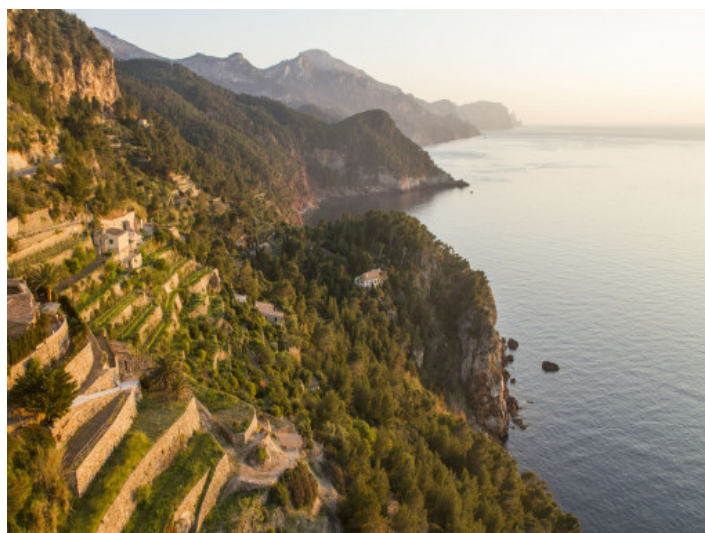
Küstenabschnitt bei Bañalbufar