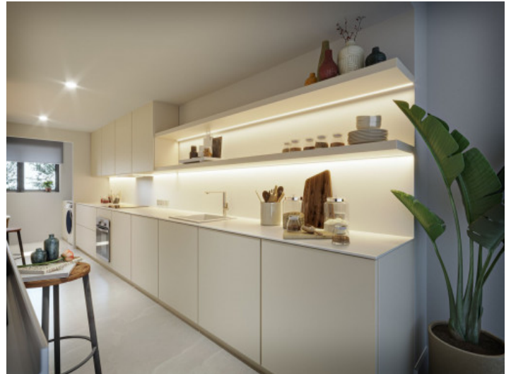
Halb offene Raumplanung