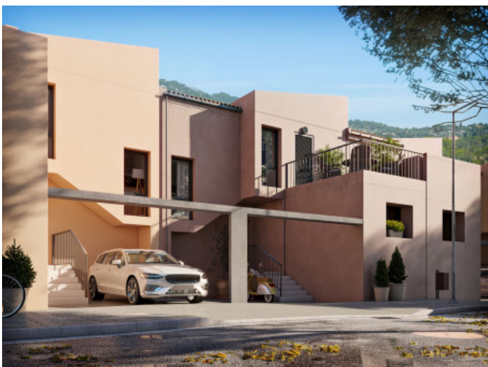
Blick auf die Fassade