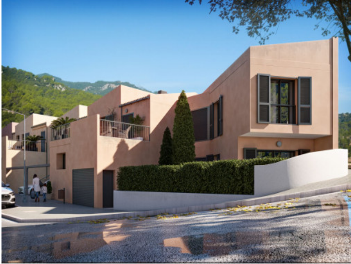
Ansicht auf die Reihenhäuser