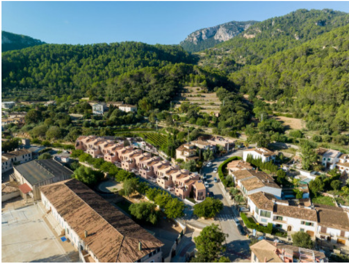
Blick von oben