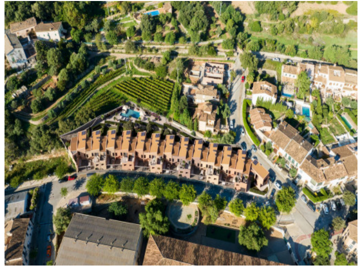
Blick von oben