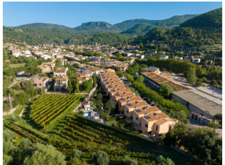
Blick von oben