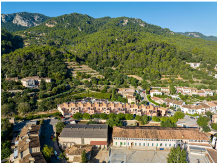
Blick von oben