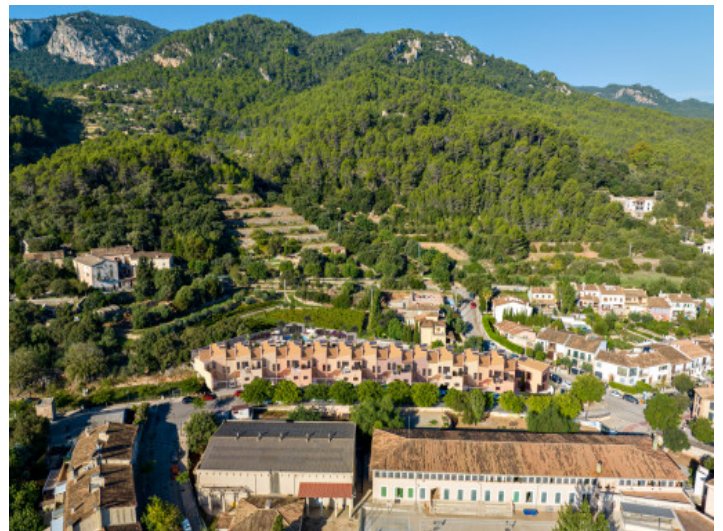
Die Reihenhäuser sind ideal im Ort integriert