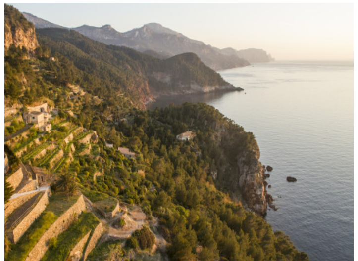
Küste in Bañalbufar

Alle Angaben nach bestem Wissen. Irrtum und Zwischenverkauf vorbehalten. Dieses Exposé ist eine Vorinformation, als Rechtsgrundlage gilt allein der notariell abgeschlossene Kaufvertrag.