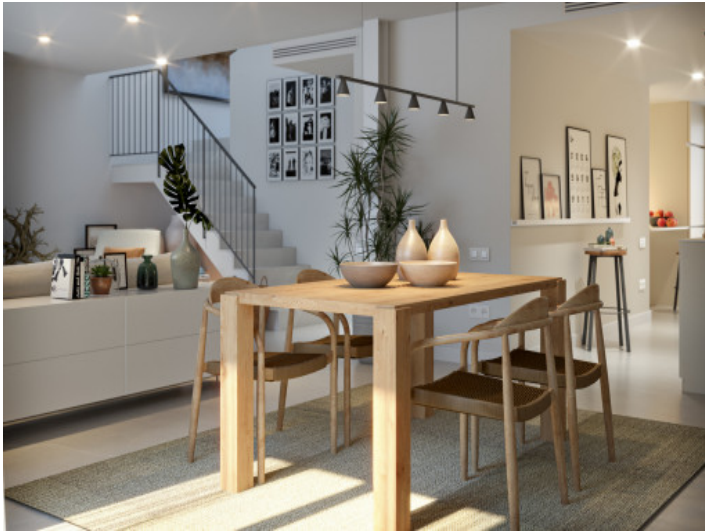
Ess und Küchenbereich