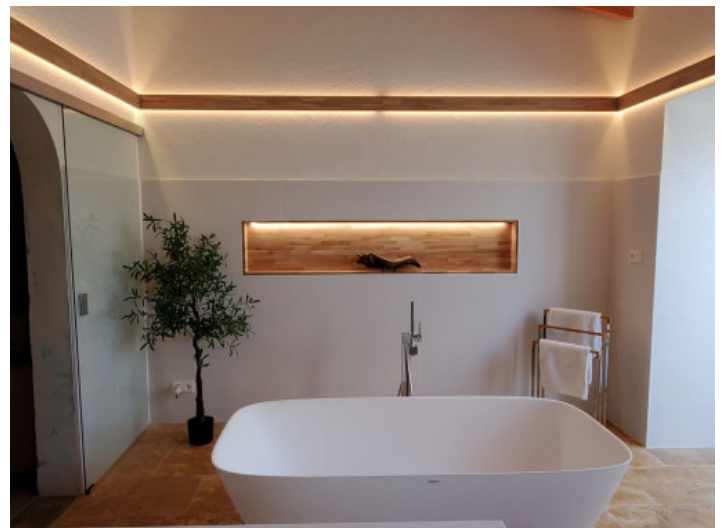
Eins von 4 Badezimmern

Alle Angaben nach bestem Wissen. Irrtum und Zwischenverkauf vorbehalten. Dieses Exposé ist eine Vorinformation, als Rechtsgrundlage gilt allein der notariell abgeschlossene Kaufvertrag.