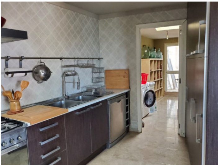
Küche und Haushaltsraum