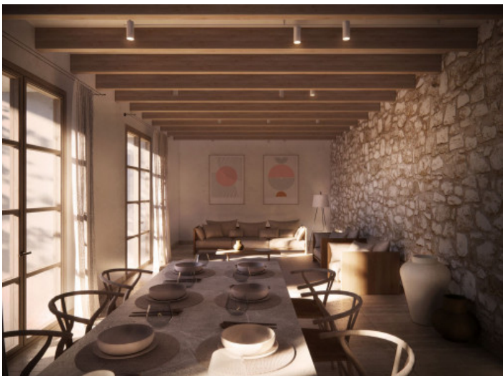
Ess- und Wohnbereich