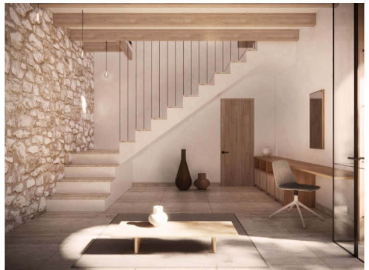
Eingangshalle und Treppenaufgang

Alle Angaben nach bestem Wissen. Irrtum und Zwischenverkauf vorbehalten. Dieses Exposé ist eine Vorinformation, als Rechtsgrundlage gilt allein der notariell abgeschlossene Kaufvertrag.