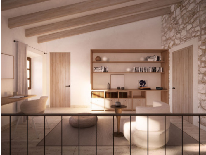
Wohnzimmer im Obergeschoss