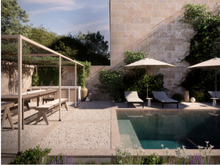
Stadthausprojekt mit großem Garten, Pool, Garage und Blick in Lloret De