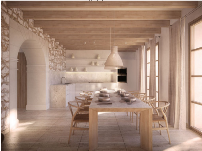
Essbereich und Küche