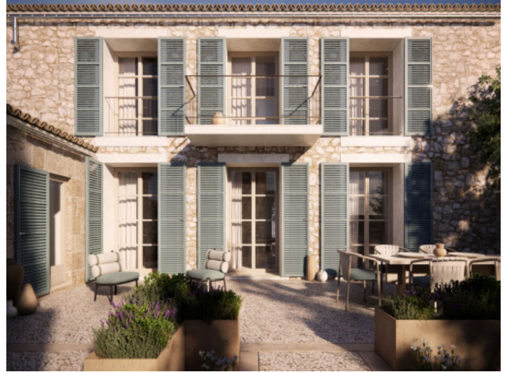
Fassade und Terrasse