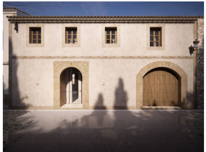
Blick von der Straße