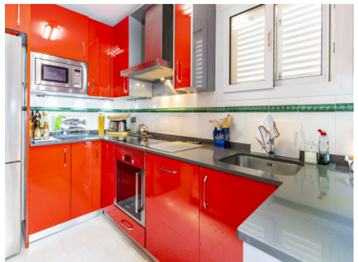
Voll ausgestattete Einbauküche

Alle Angaben nach bestem Wissen. Irrtum und Zwischenverkauf vorbehalten. Dieses Exposé ist eine Vorinformation, als Rechtsgrundlage gilt allein der notariell abgeschlossene Kaufvertrag.