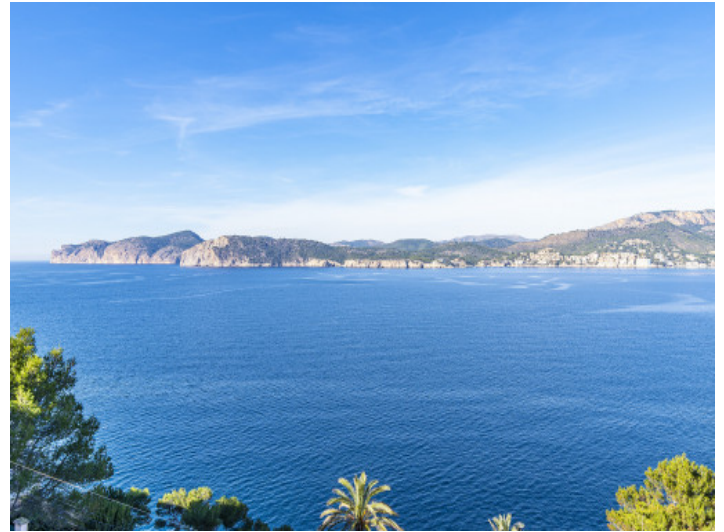
Traumaussicht auf das Mittelmeer