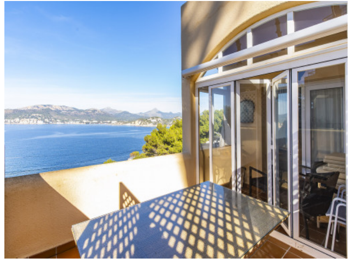
Terrasse mit Meerblick