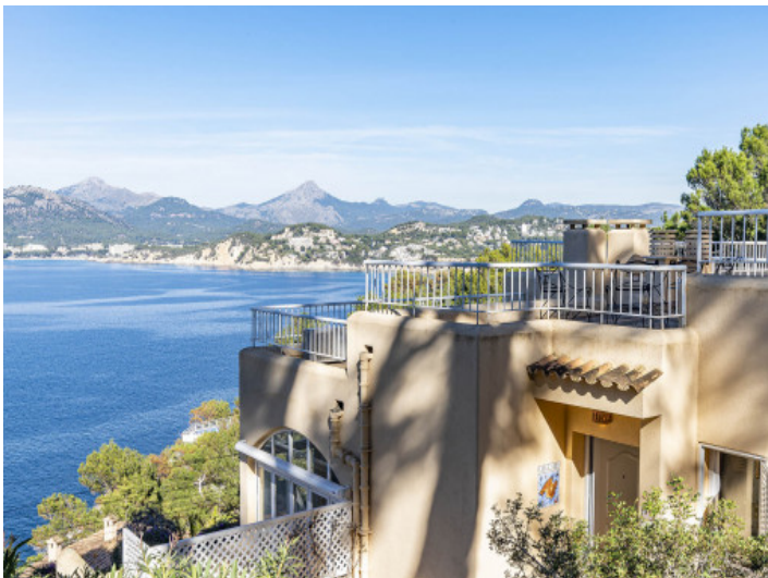
Ansicht auf die Wohnanlage