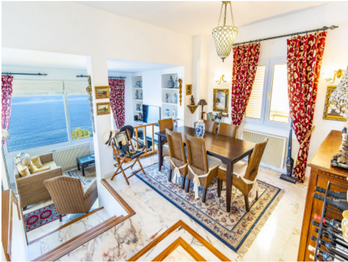
Heller Wohn- und Essbereich