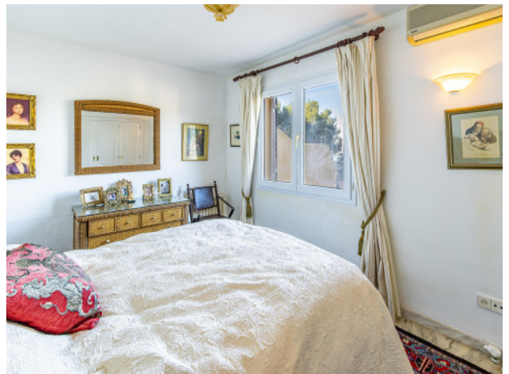
Schlafzimmer mit Badezimmer en Suite

Alle Angaben nach bestem Wissen. Irrtum und Zwischenverkauf vorbehalten. Dieses Exposé ist eine Vorinformation, als Rechtsgrundlage gilt allein der notariell abgeschlossene Kaufvertrag.