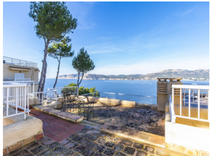
Dachterrasse mit frontalem Meerblick