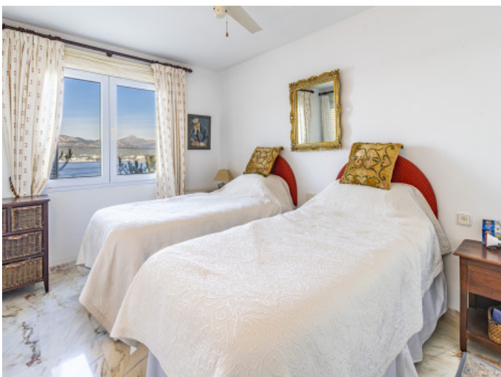
Das 2. Schlafzimmer