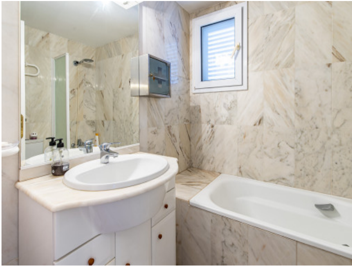
Badezimmer en Suite