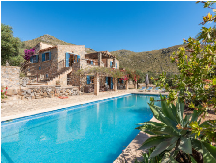
Poolbereich und Fassade