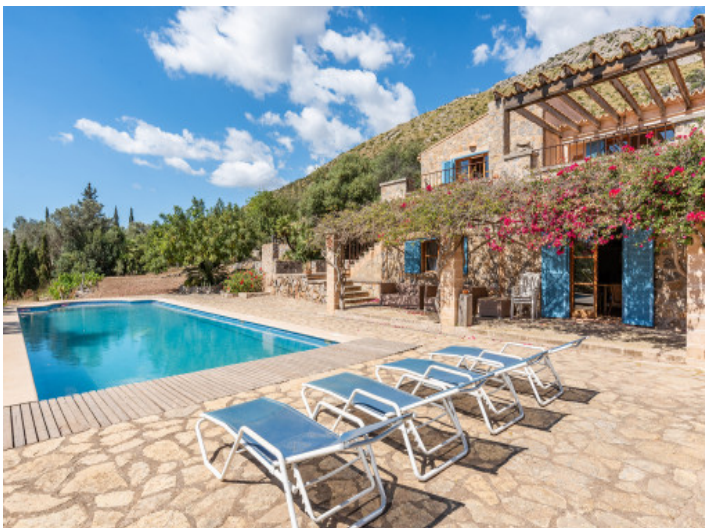
Poolbereich und Fassade