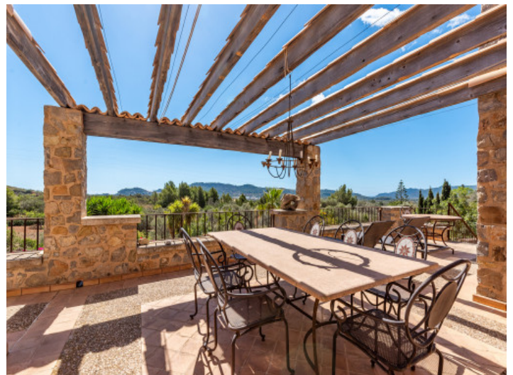
Essbereich auf der Terrasse

Alle Angaben nach bestem Wissen. Irrtum und Zwischenverkauf vorbehalten. Dieses Exposé ist eine Vorinformation, als Rechtsgrundlage gilt allein der notariell abgeschlossene Kaufvertrag.