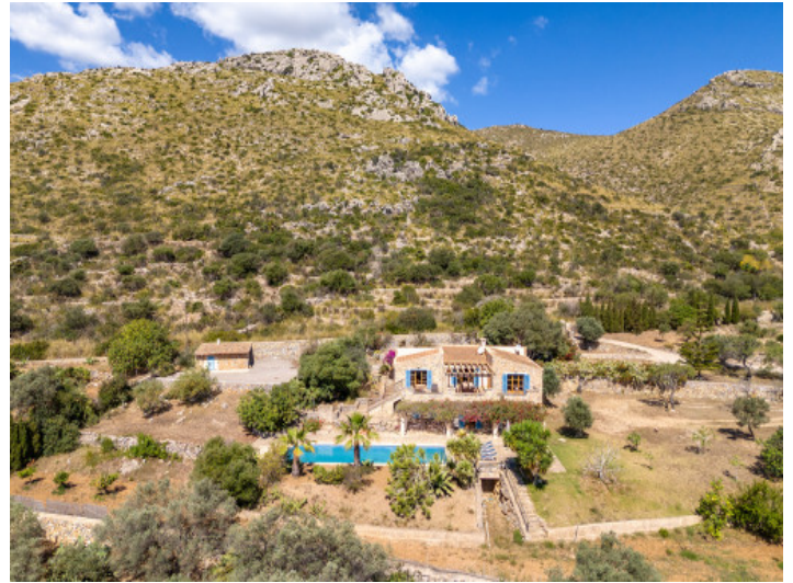
Ansicht auf die Finca