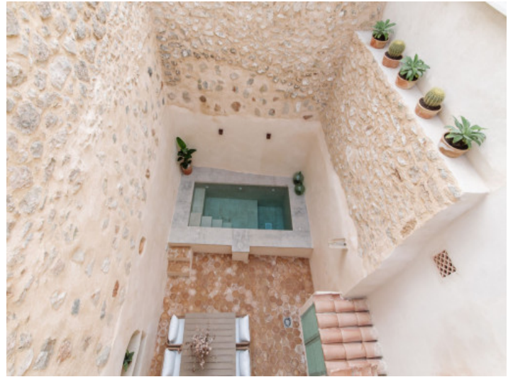
Patio mit Pool