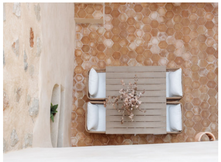
Ruhiger Bereich auf der Terrasse

Alle Angaben nach bestem Wissen. Irrtum und Zwischenverkauf vorbehalten. Dieses Exposé ist eine Vorinformation, als Rechtsgrundlage gilt allein der notariell abgeschlossene Kaufvertrag.