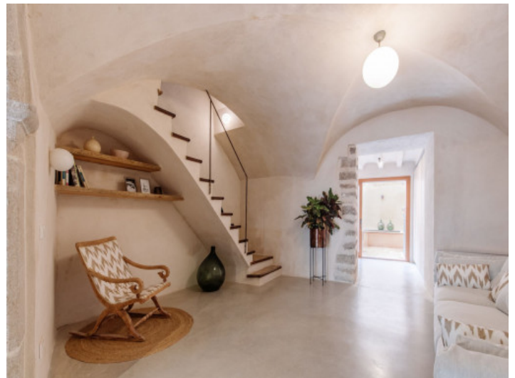
Eingangsbereich des Stadthauses