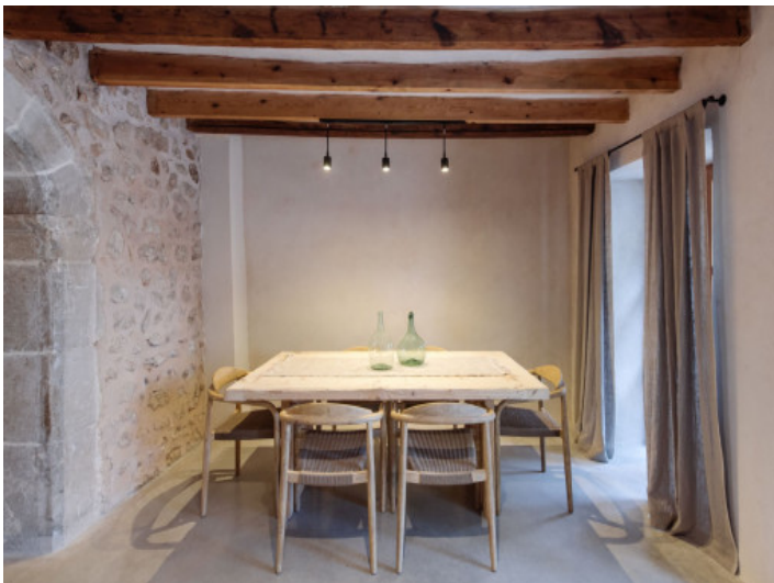
Essbereich des Stadthauses