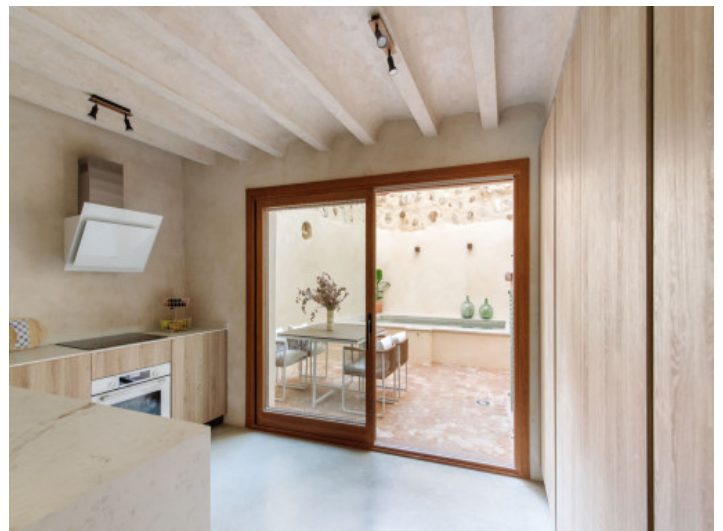
Küche mit direktem Terrassenzugang

Alle Angaben nach bestem Wissen. Irrtum und Zwischenverkauf vorbehalten. Dieses Exposé ist eine Vorinformation, als Rechtsgrundlage gilt allein der notariell abgeschlossene Kaufvertrag.