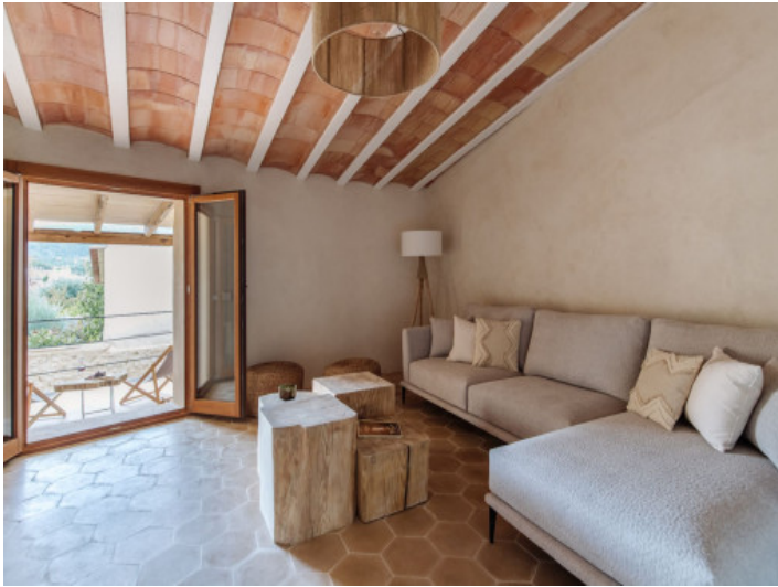
Traumhaft saniertes Dorfhaus im Zentrum von Alaró