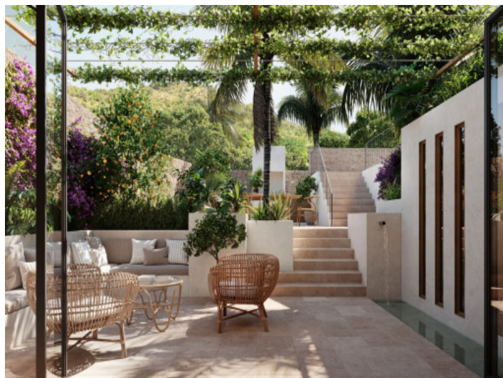
Schön angelegte Terrasse