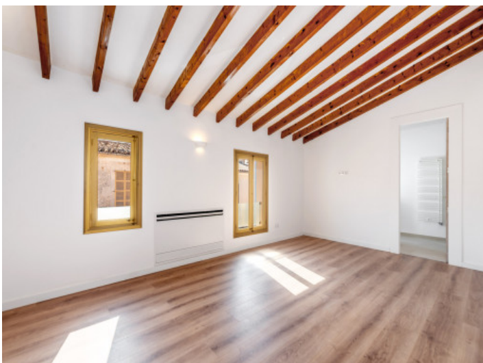
Schlafzimmer mit Badezimmer en Suite