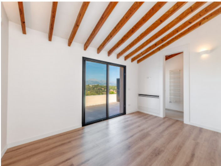
Schlafzimmer mit Balkonzugang