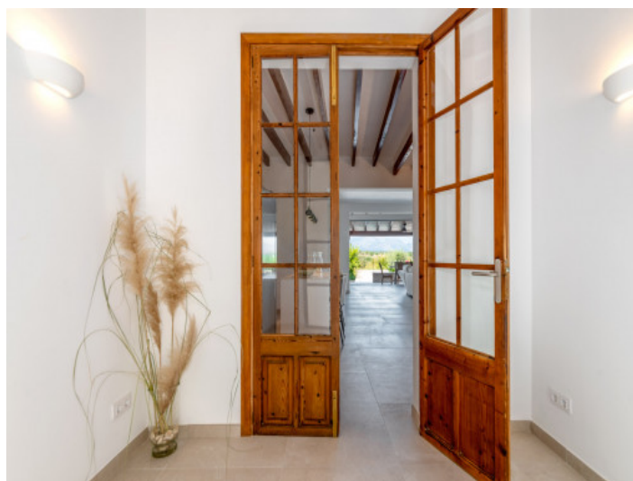
Eingangsbereich des Stadthauses