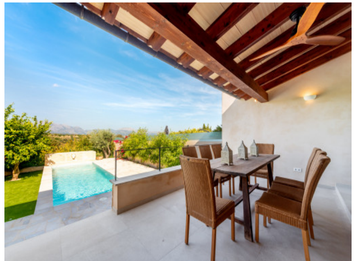
Terrasse des Stadthauses