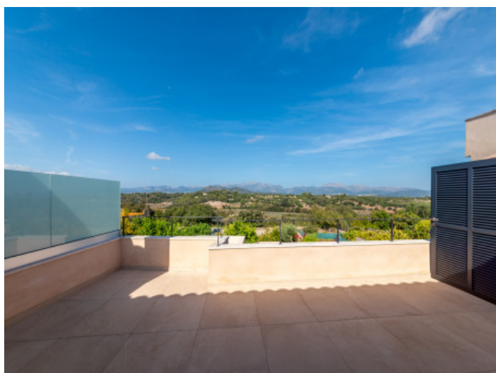
Brillianter Blick über die Landschaft