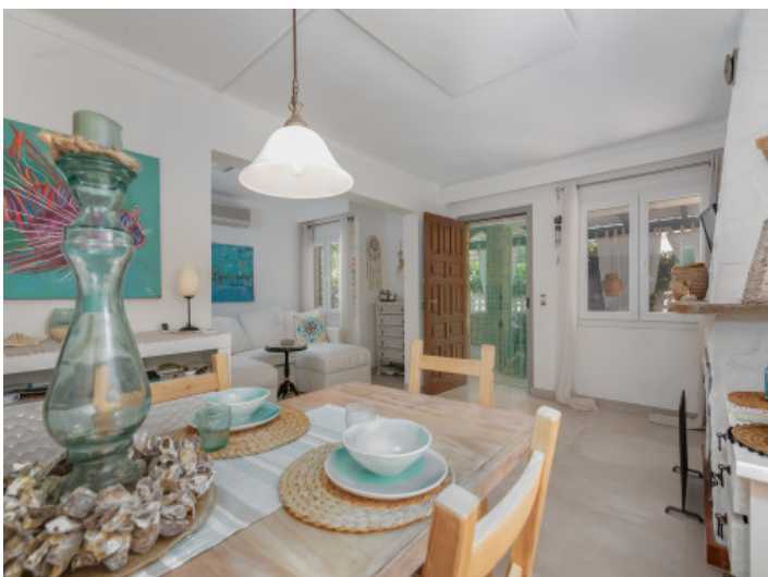
Essbereich mit Kamin