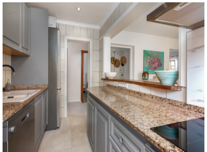
Komplett ausgestattete Küche

Alle Angaben nach bestem Wissen. Irrtum und Zwischenverkauf vorbehalten. Dieses Exposé ist eine Vorinformation, als Rechtsgrundlage gilt allein der notariell abgeschlossene Kaufvertrag.