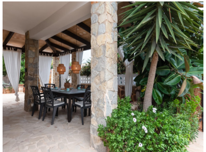
Überdachte Terrasse mit Essbereich