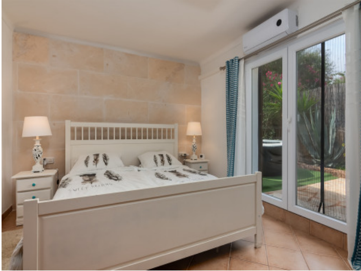
Eines von 2 Schlafzimmern