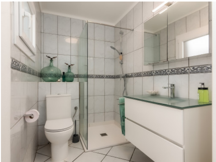
Eines von 2 Badezimmern