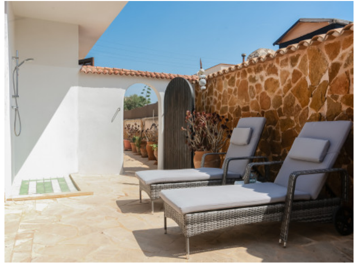
Sonnenterrasse mit Außendusche