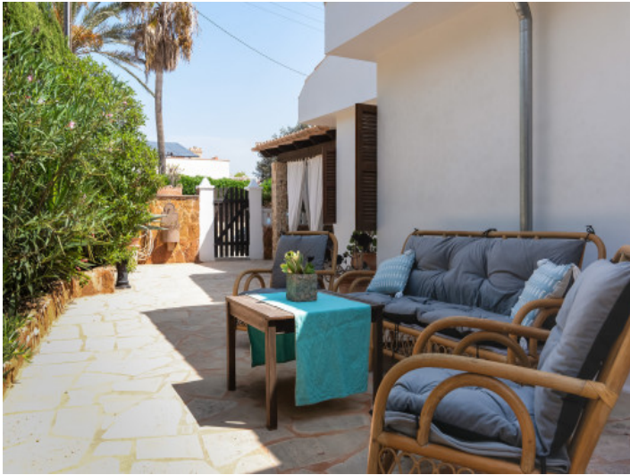
Terrasse mit gemütlichem Sitzbereich