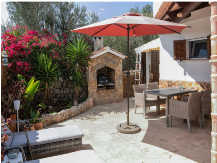
Grillbereich mit Sitzgelegenheit