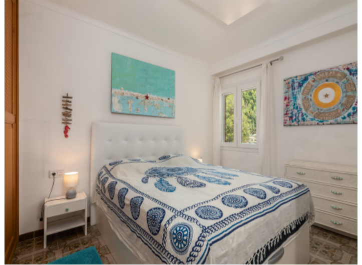
Eines von 2 Schlafzimmern