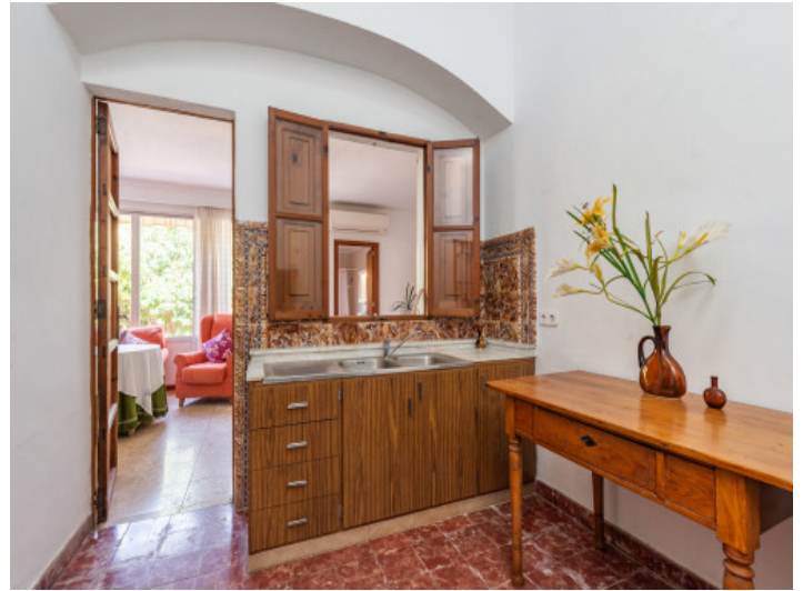
Zugang zur kleinen Küche