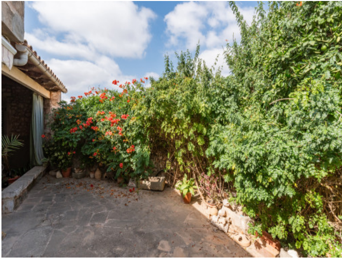
Angrenzende Terrasse im Außenbereich