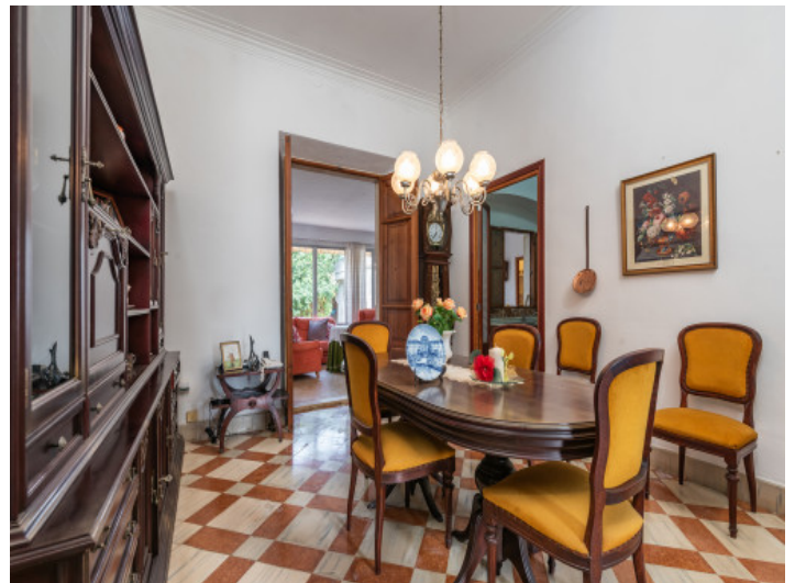
Zugang zum Essbereich