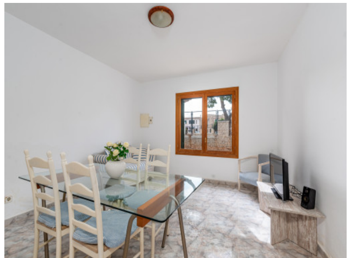
Wohnbereich im Obergeschoss

Alle Angaben nach bestem Wissen. Irrtum und Zwischenverkauf vorbehalten. Dieses Exposé ist eine Vorinformation, als Rechtsgrundlage gilt allein der notariell abgeschlossene Kaufvertrag.