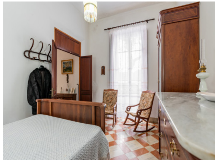
Schlafzimmer im Erdgeschoss