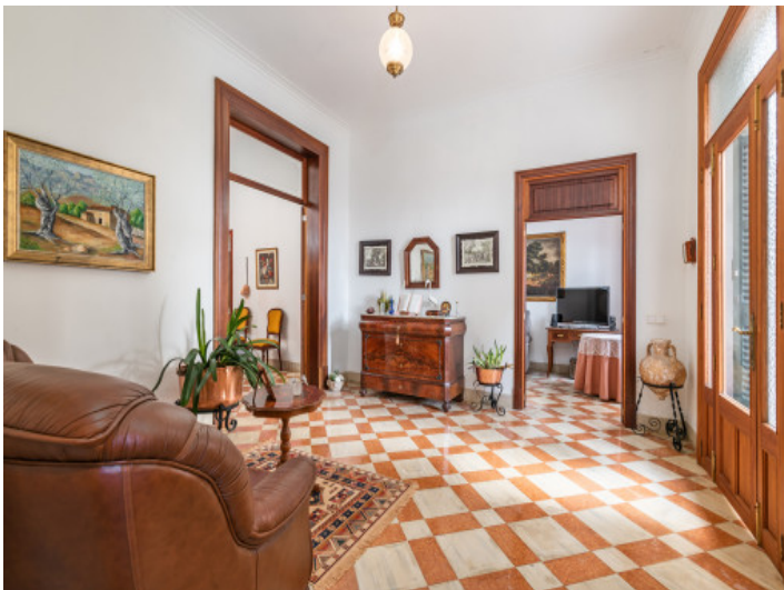
Traditioneller Eingang zum Haus