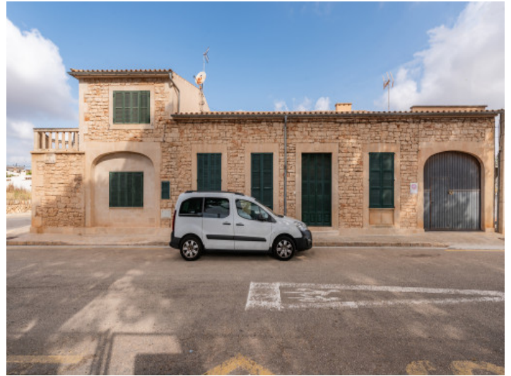
Außenansicht des Dorfhauses