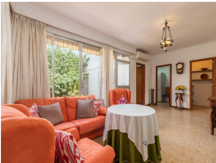
Heller Wohnbereich mit Patiozugang