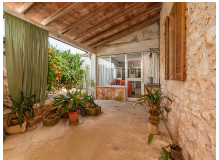
Große, überdachte Terrasse

Alle Angaben nach bestem Wissen. Irrtum und Zwischenverkauf vorbehalten. Dieses Exposé ist eine Vorinformation, als Rechtsgrundlage gilt allein der notariell abgeschlossene Kaufvertrag.