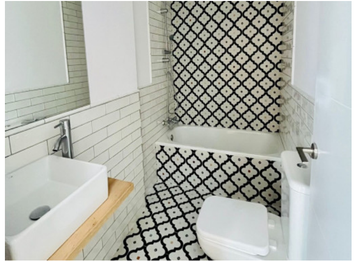
Eines von 2 Badezimmern