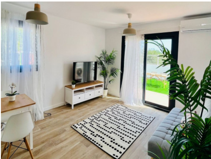
Wohnbereich mit Terrassenzugang