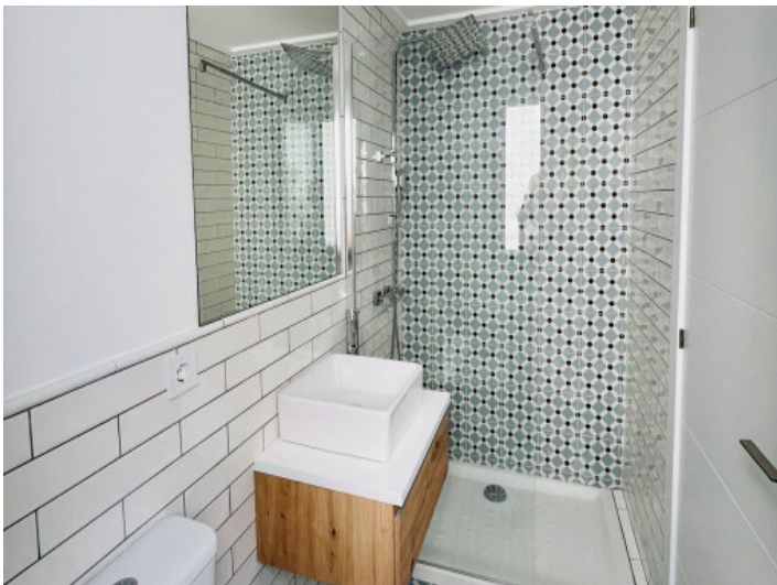
Eines von 2 Badezimmern

Alle Angaben nach bestem Wissen. Irrtum und Zwischenverkauf vorbehalten. Dieses Exposé ist eine Vorinformation, als Rechtsgrundlage gilt allein der notariell abgeschlossene Kaufvertrag.