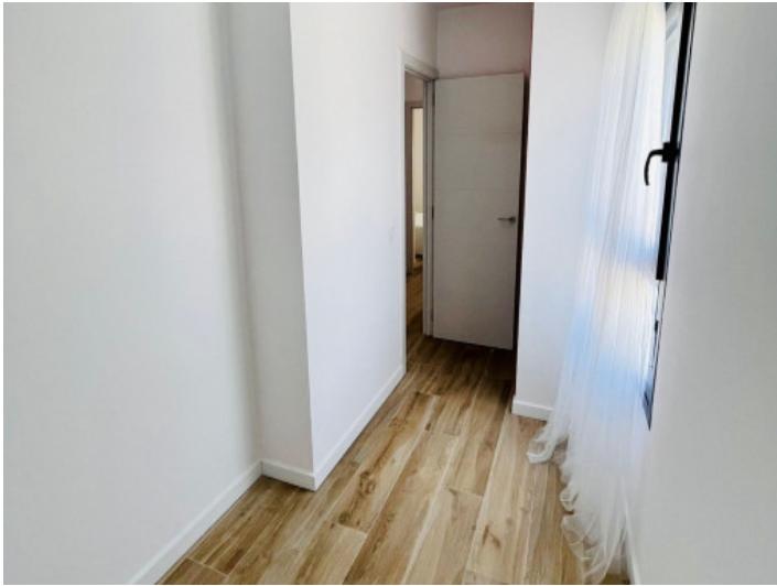
Eines von 3 Schlafzimmern