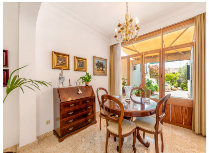
Essbereich mit Terrassenzugang

Alle Angaben nach bestem Wissen. Irrtum und Zwischenverkauf vorbehalten. Dieses Exposé ist eine Vorinformation, als Rechtsgrundlage gilt allein der notariell abgeschlossene Kaufvertrag.