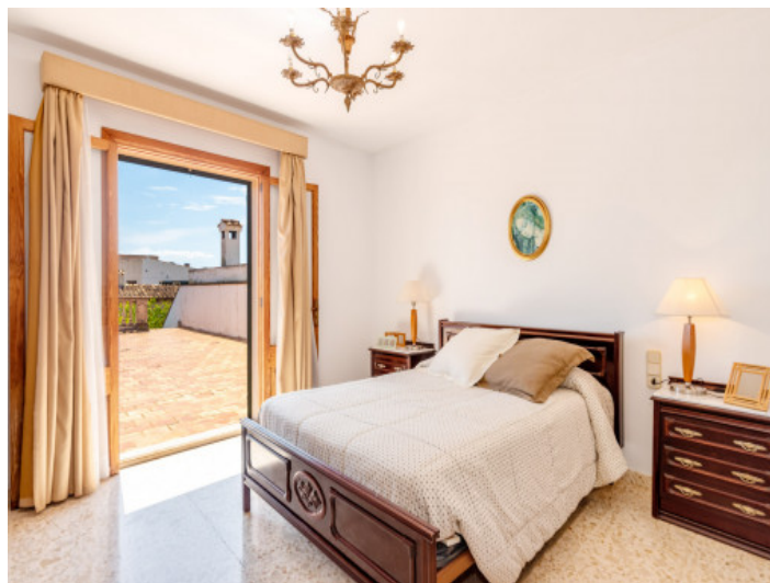
Schlafzimmer mit Dachterrasse