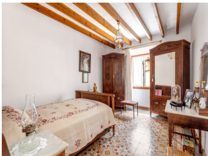
Schlafzimmer mit Dachterrasse