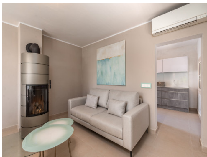
Weitere Ansicht des Wohnzimmers