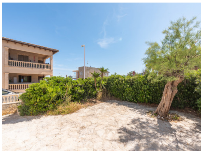
Innenhof / Terrasse