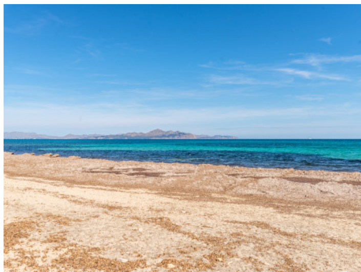
Fußläufige Entfernung zum Strand

Alle Angaben nach bestem Wissen. Irrtum und Zwischenverkauf vorbehalten. Dieses Exposé ist eine Vorinformation, als Rechtsgrundlage gilt allein der notariell abgeschlossene Kaufvertrag.