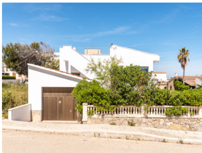
Hausansicht von der Straße