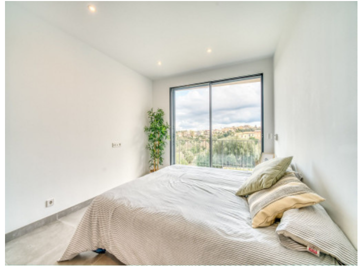
Hauptschlafzimmer mit Badezimmer en Suite