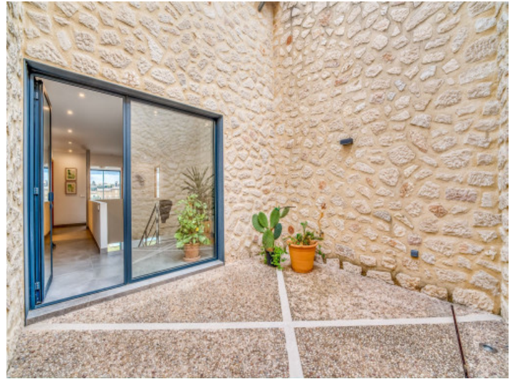
Patio mit Natursteinwand