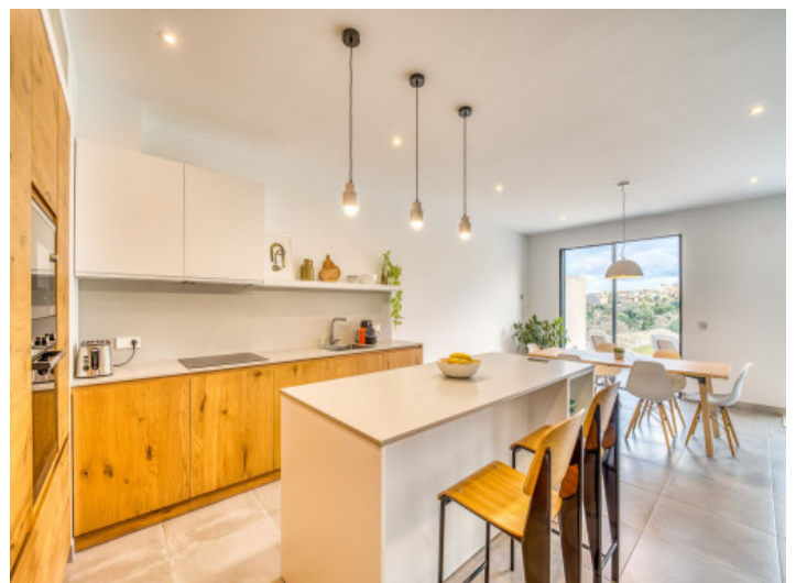
Küche mit Kochinsel

Alle Angaben nach bestem Wissen. Irrtum und Zwischenverkauf vorbehalten. Dieses Exposé ist eine Vorinformation, als Rechtsgrundlage gilt allein der notariell abgeschlossene Kaufvertrag.