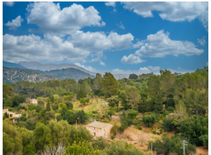
Weitblick in die Landschaft