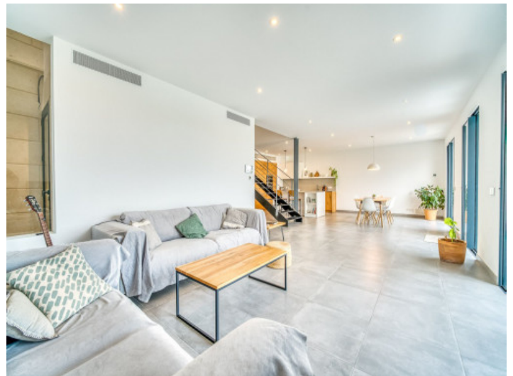
Offener Wohnbereich und Küche