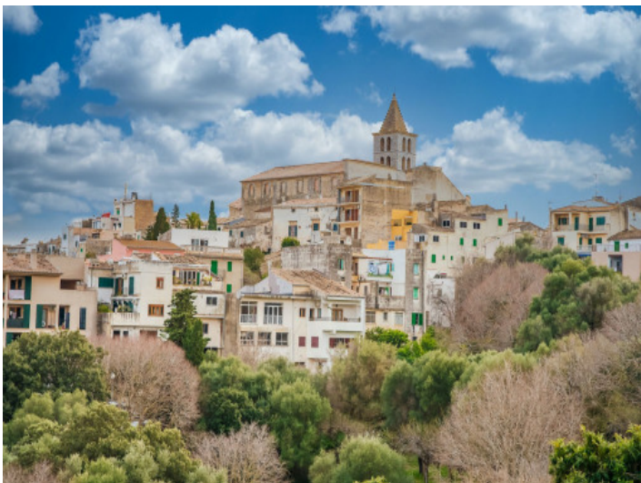
Blick auf Campanet

Alle Angaben nach bestem Wissen. Irrtum und Zwischenverkauf vorbehalten. Dieses Exposé ist eine Vorinformation, als Rechtsgrundlage gilt allein der notariell abgeschlossene Kaufvertrag.