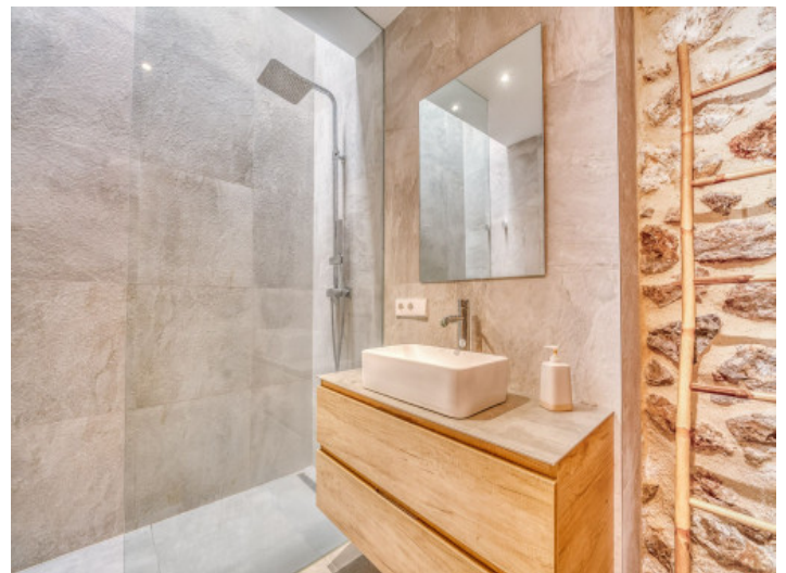
Modernes Badezimmer mit ebenerdiger Dusche

Alle Angaben nach bestem Wissen. Irrtum und Zwischenverkauf vorbehalten. Dieses Exposé ist eine Vorinformation, als Rechtsgrundlage gilt allein der notariell abgeschlossene Kaufvertrag.