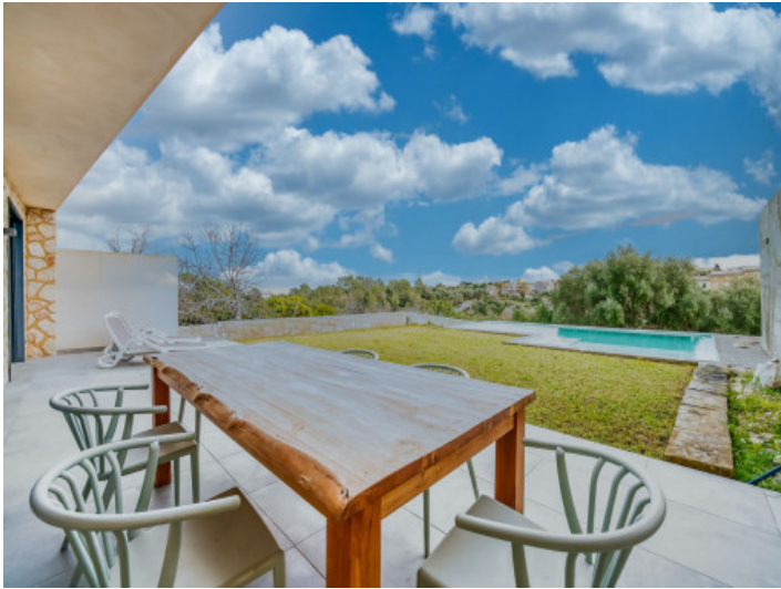
Blick von der Terrasse