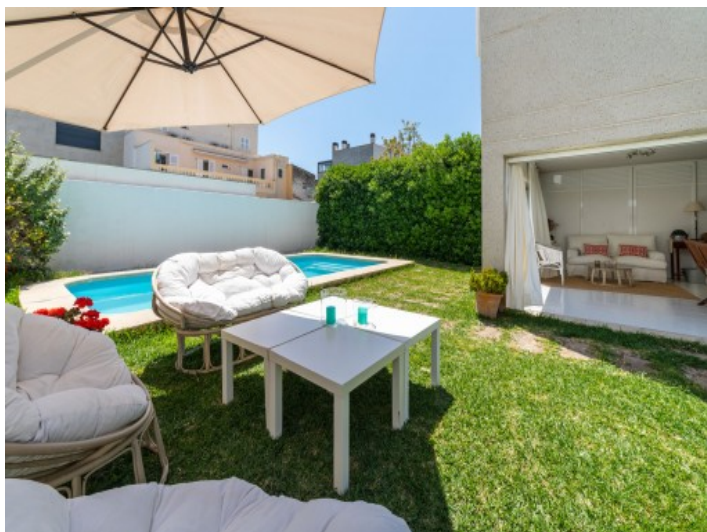
Schöner, privater Garten mit Pool