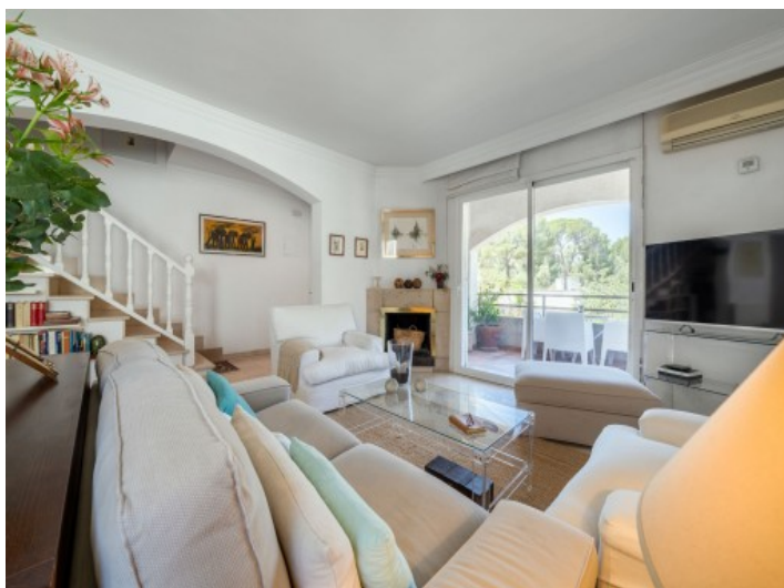
Haupt-Wohnbereich im ersten Stockwerk