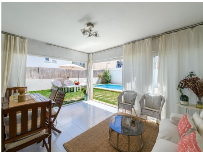
Erdgeschoss mit offenem Zugang zum Garten