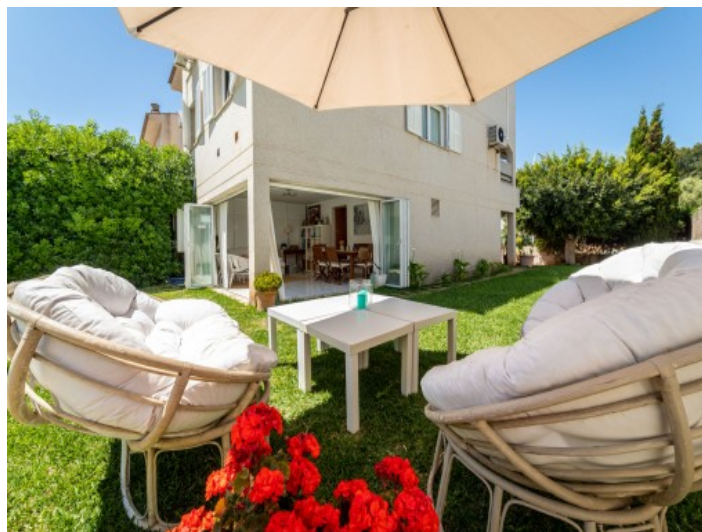
Entspannter Loungebereich im Garten