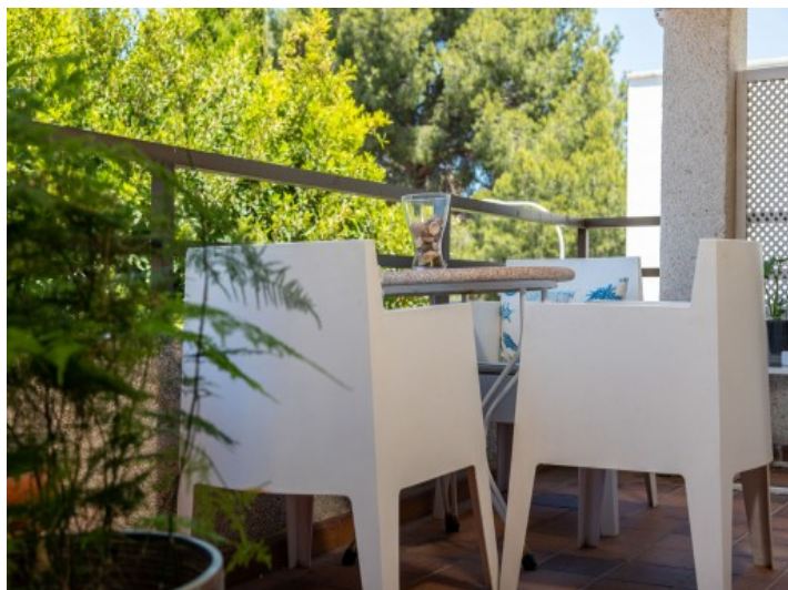
Balkon mit Sitzbereich