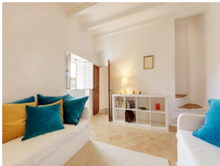
Alternative Ansicht des Wohnzimmers