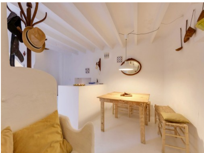
Essbereich mit Charakter