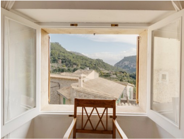
Traumhafter Blick auf die Berge