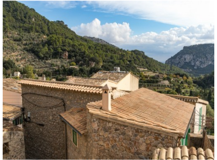
Blick über das Dorf

Alle Angaben nach bestem Wissen. Irrtum und Zwischenverkauf vorbehalten. Dieses Exposé ist eine Vorinformation, als Rechtsgrundlage gilt allein der notariell abgeschlossene Kaufvertrag.