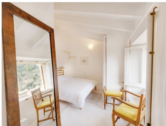
Wundervolles Schlafzimmer im zweiten Stockwerk