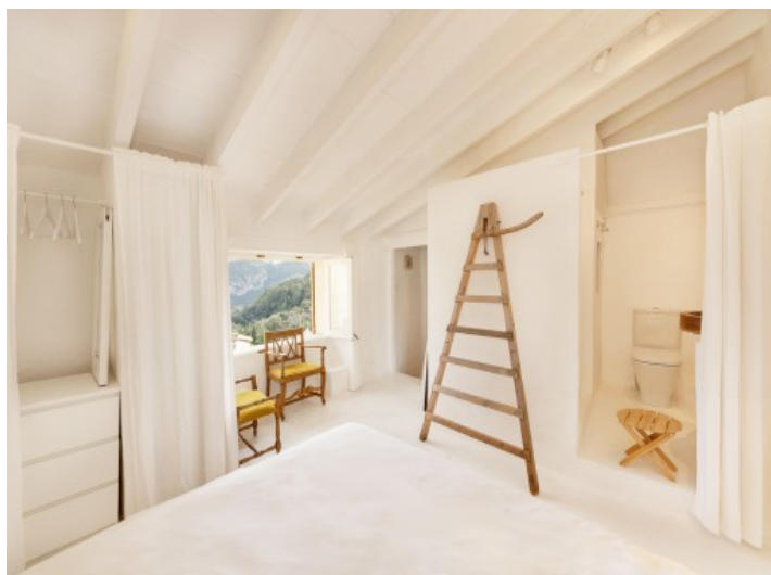
Geschmackvoll renoviertes Schlafzimmer