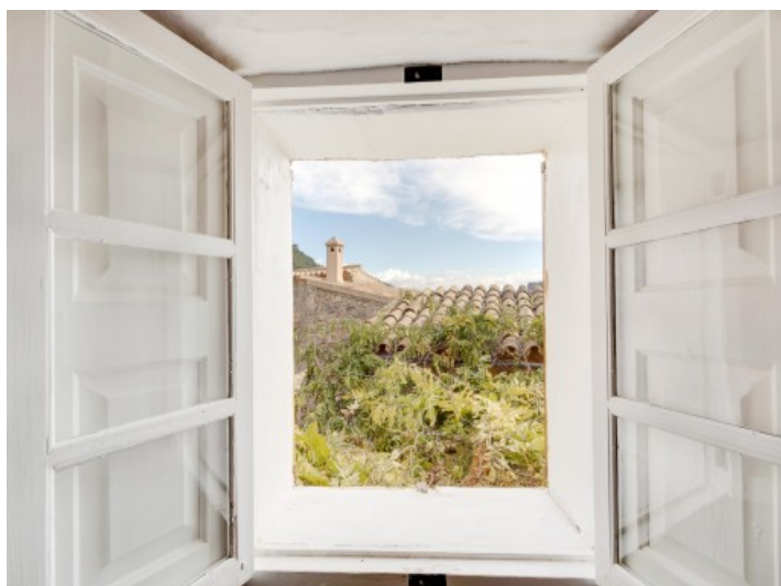
Ausblick vom Wohnzimmer