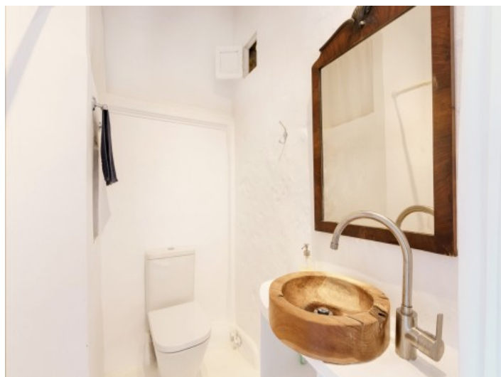
Kleines en Suite Badezimmer

Alle Angaben nach bestem Wissen. Irrtum und Zwischenverkauf vorbehalten. Dieses Exposé ist eine Vorinformation, als Rechtsgrundlage gilt allein der notariell abgeschlossene Kaufvertrag.