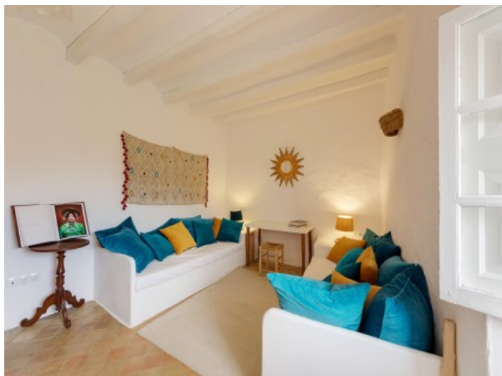
Komfortabler Wohnbereich im Obergeschoss